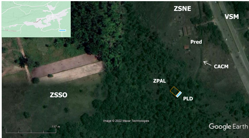
Figura 1. Área de estudio dentro de la periferia urbana de la ciudad de Maturín, hacia la salida sur (recuadro azul superior izquierdo), desarrollada con el sistema SIG Google Earth®. Leyenda: ZSSO: zona de sabana suroeste; ZSNE: zona de sabana noreste; Pred: antiguas estructuras del Jardín Botánico “Morichalote”; ZPAL: zona de estudio específica de plantas acuáticas en sector semiléntico; PLD: antiguo puente las delicias; VSM: vía hacia el sur de Monagas; CACM: canal de aliviadero de la cuenca del morichal, en desvío hacia la zona noreste baja.

subdividida cada 0,5 m sobre el transecto para estimar con una vara recta graduada las profundidades de la lámina de agua por punto, así determinar el perfil del cuerpo acuático (Figura 2). Se identificó y colectó el material vegetal en sus diversas formas de vida y se preservó según los métodos descritos por Lot y col. (2015). Se realizaron secado, prensado y montaje según lo descrito por Jones (1986).