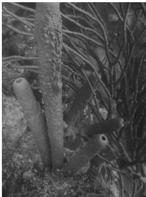
Figura 1. Aplysina archeri

1999, Álvarez y Díaz 1985, Villamizar 1985, Romero 2004). Esta comunidad bacteriana deberá ser notablemente distinta a la del agua circundante, lo cual nos indicaría que efectivamente es una comunidad fuertemente asociada a la esponja, adaptada a las condiciones de refugio, alta disponibilidad de nutrientes y demás condiciones que representa el tejido como nicho ecológico.