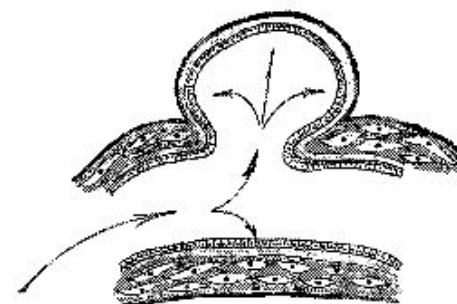
Fig. 1. Patogénesis en la formación de un divertículo yeyunal.

La patogénesis de la diverticulosis yeyuno ileal se debe a alteraciones en la peristalsis, discinesia intestinal y aumento de la presión intraluminal. Estos emergen en el borde mesentérico donde los vasos penetran al intestino. Existen dos variantes los de tipo pulsión con un delgado cuello donde la capa muscular es delgada o no existe y los tipo de cuello ancho con fibrosis de la capa muscular, esta debilidad de la pared intestinal y la protuberancia de la mucosa y submucosa, se produciría por un aumento de la pulsión). Aunque no se tienen estudios de la medición directa de la presión intraluminal (4) , (Fig. 1).