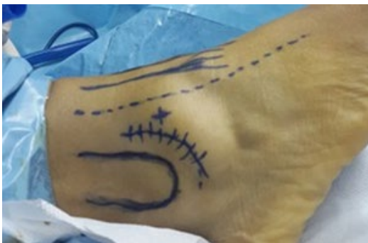
Figura 1. Referencias anatómicas, portales y abordajes.

Se realiza un procedimiento artroscópico anterior previo para realizar: sinovectomía anterior y excéresis del ligamento de Basset, de estar engrosado (Figura 1).