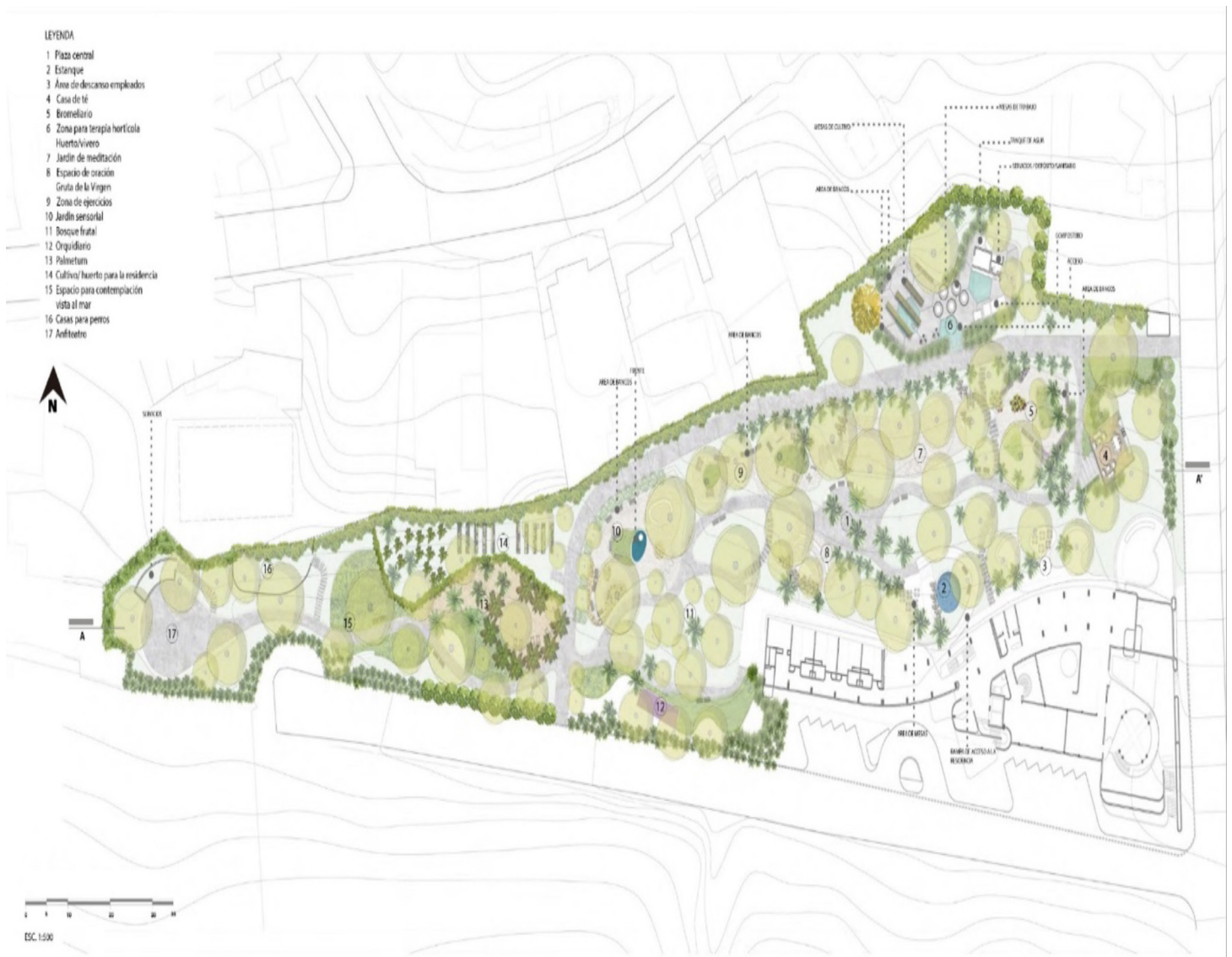
Imagen 3. Propuesta paisajista

sistema de caminos que permiten recorridos variados por el jardín y estableciendo ambientes distintivos que atienden a las necesidades especiales de residentes, visitantes y trabajadores (imagen 3).