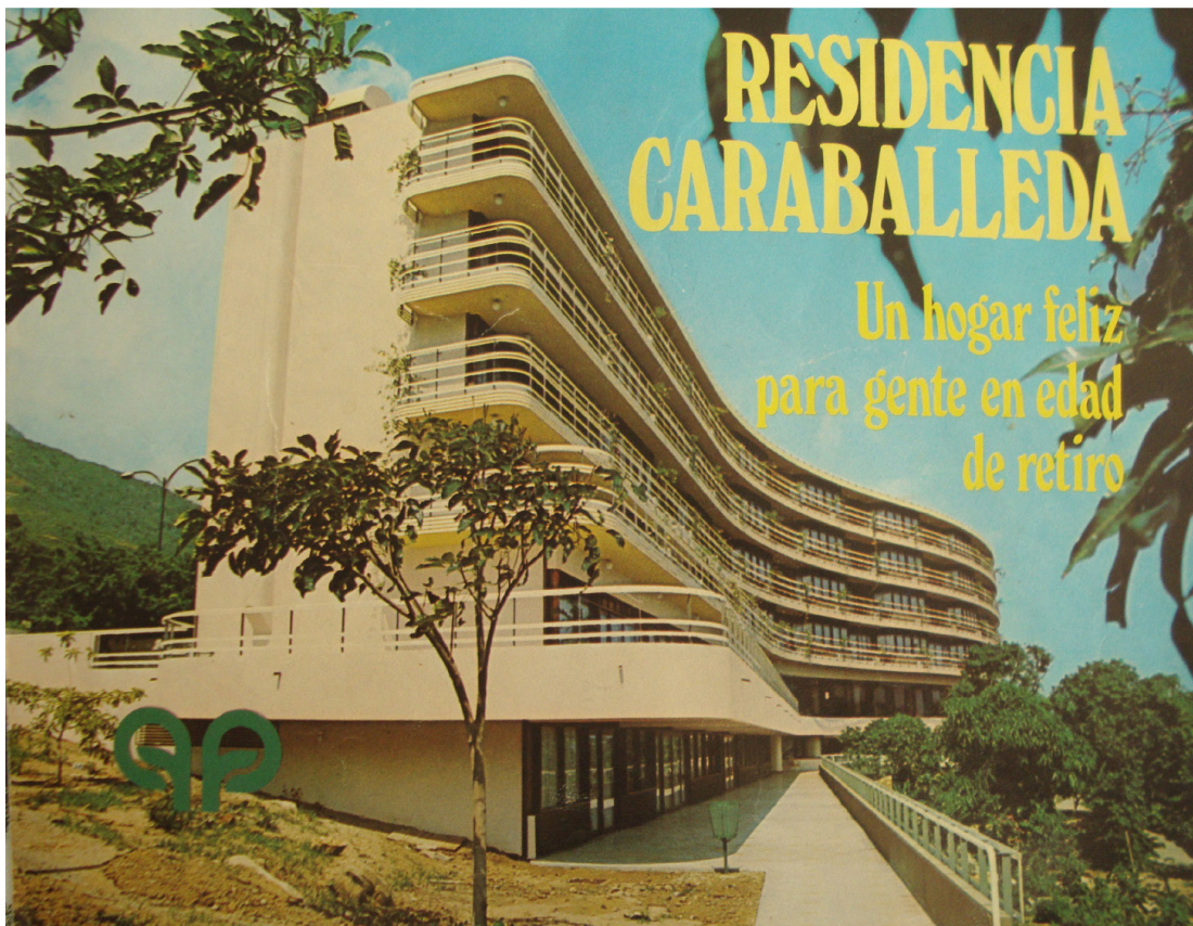
Imagen 1. Portada del folleto informativo de la Residencia Caraballeda cuando fue inaugurada

Con el tiempo, el concepto ha evolucionado para incluir a personas con necesidades especiales, asignando los dos primeros niveles de habitaciones a quienes requieren asistencia constante. Actualmente, 35% de los residentes sufre de Alzheimer u otras formas de demencia, y aunque solo un 8% utiliza sillas de ruedas, la mayoría depende de andaderas o bastones. La residencia ofrece terapia ocupacional y alternativas como la acupuntura, y desde hace cinco años, mantiene una alianza con EDEPA, una organización civil enfocada en la integración social y ambiental de los adultos mayores.