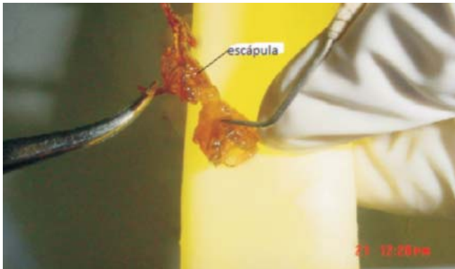
Fig.1. En la fotografía se observa el comienzo del proceso de osificación en la escápula de un esqueleto de feto de 9 semanas de gestación.

En el proceso de osificación de la escápula, pudimos observar que en la semana 8, el primer centro de osificación primario en aparecer es el que corresponde a la fosa infra espinosa, conjuntamente con un núcleo de osificación secundario para en la base del proceso espinoso. Posteriormente en la semana 9 es posible observar un pequeño núcleo coloreado, el cual se ubica en el centro de la fosa supra espinosa (ver Fig. No 1). Luego en la semana 13 se observan 3 pequeños núcleos de aspecto redondeado ubicados en la base del acromion, en su cuello y en la cavidad glenoidea de la escápula (Ver Tabla II). En su proceso de osificación la escápula muestra un amplio borde cartilaginoso que rodea sus bordes superior, externo y hacia su ángulo inferior (ver fig. N° 2) adoptando y manteniendo el borde de la zona osificada un aspecto de semi circunferencia.