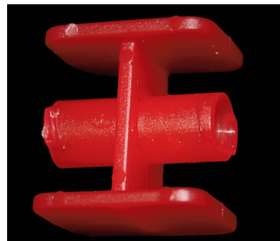
Figura 2: Conector de Luer-Lock a Luer Lock.