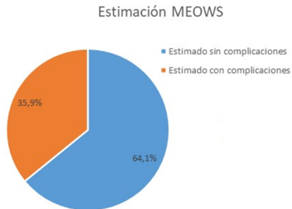
Tabla 4. Distribución de pacientes según resultados del marcador materno de alerta temprana (MEWT)