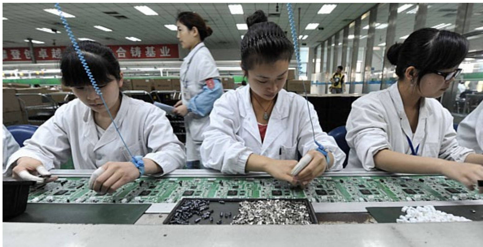
Figura 4. Una gran parte del éxito de Shenzhen que ha llevado a que se le conozca como el Silicon Valley chino es el ecosistema que ha creado. Si fabricas allí tienes a cualquier proveedor cerca: Qualcomm, MediaTek, Samsung, Intel... toda la “supply chain” está presente en la ciudad china.

Shenzhen se ha beneficiado enormemente de la atención del máximo liderazgo de China. Cada uno