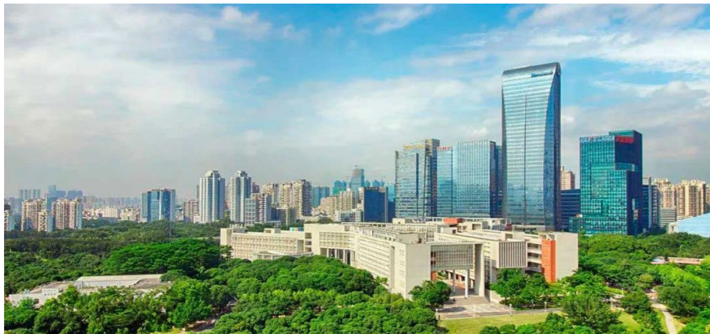
Figura 5. Universidad de Shenzhen es una universidad completa a tiempo completo acreditado por el Consejo de Estado de la República Popular de China y es financiado por el gobierno local de Shenzhen. SZU se fundó en 1983 y realizó su primera inscripción el mismo año en lo que Deng Xiaoping llamó “Velocidad de Shenzhen”.