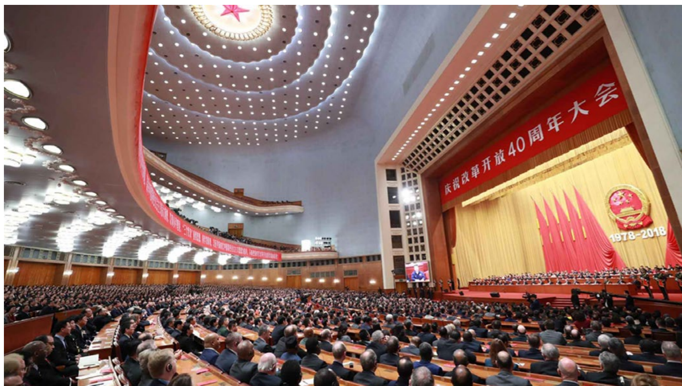
Figura 3. Discurso pronunciado por el presidente Xi Jinping en el marco de la celebración de los 40 años de la apertura económica de China.

al capitalismo. Se explicó que esta política fue y sigue siendo una estrategia, que ha funcionado a la perfección como lo demuestran las estadísticas del banco mundial.