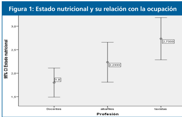
Con una probabilidad del 95%, el grupo de los taxistas tienen peso más elevado en relación con las otras profesiones.