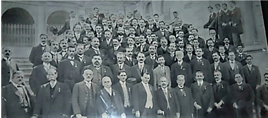
Figura 2. Asistentes al Primer Congreso Venezolano de Medicina, 1911.

de julio de 1811), el III, el centenario de la batalla de Carabobo, el IV: el centenario de la batalla de Ayacucho y el V: el inicio de la presidencia de Juan Vicente Gómez (19 de diciembre de 1908).