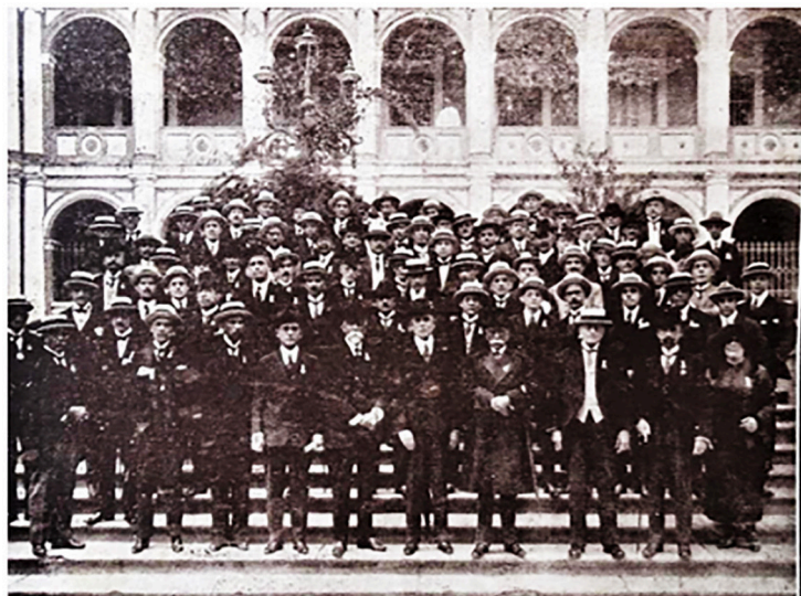
Figura 5. Grupo de asistentes al IV Congreso en Caracas (16).