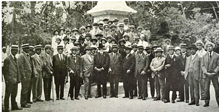
Figura 7. Asistentes al V Congreso Venezolano de Medicina. Lamina insertada entre las páginas 66 y 67 (17).

Las conferencias del Profesor P Mühlens fueron: 1° Tratamiento del paludismo por la plasmoguina. 2° Tratamiento de la parálisis general progresiva por la inoculación de paludismo y de fiebre recurrente. 3° Aplicación del verde de Schweinfürt (verde de París) en la lucha contra las larvas de los Anófeles (17, p 353-374).