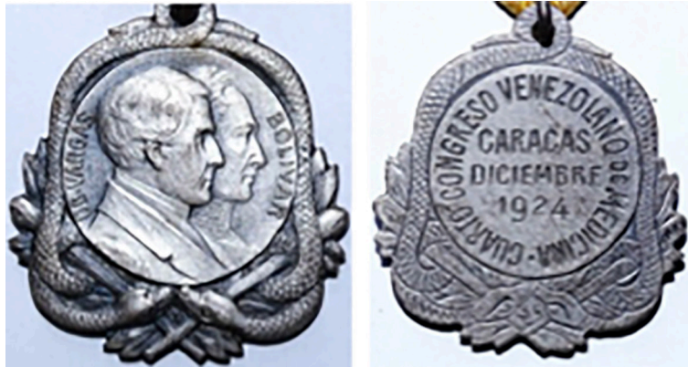
Figura 9. Medalla del IV Congreso. de una medalla existente en el Museo Felipe Tamariz de la Academia Nacional de Medicina.