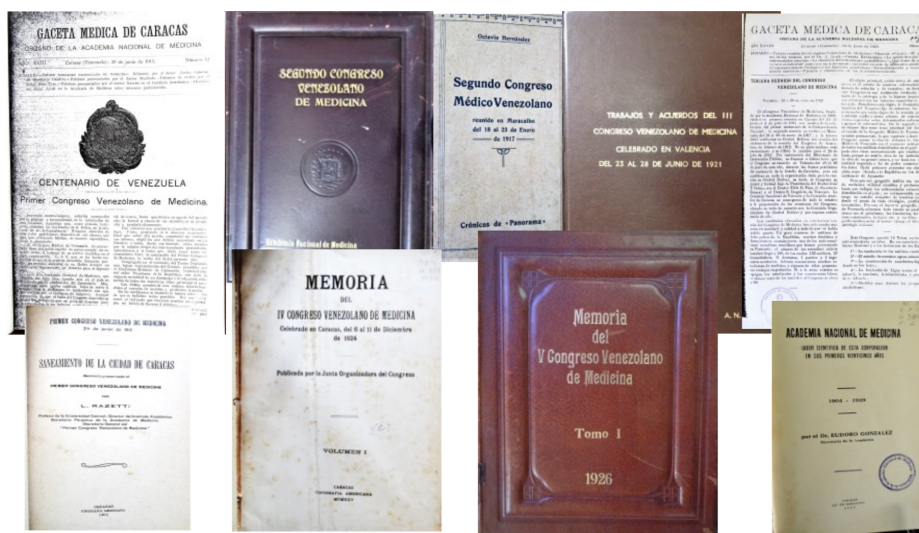
Figura 8. Publicaciones relacionadas con el Congreso Venezolano de Medicina disponibles en la biblioteca de la ANM.

El Artículo 21° del Reglamento de 1910 dice: “Todos los trabajos del Congreso se publicarán en una obra titulada “Memorias del Primer Congreso Venezolano de Medicina” . De esta obra se harán tres ediciones, una en español, otra en francés y otra en inglés” (4). No fue posible lograr esa grandiosa aspiración. Los trabajos, acuerdos, discursos e informes fueron publicados en varios números de la Gaceta Médica de Caracas (GMC), años 1911, 1912, 1913 y 1931. Hubo también publicaciones separadas de los programas, trabajos especiales y algunos informes (Figura 1). Los Congresos II, IV y V si publicaron Memoria, en español. Los trabajos del III Congreso aparecieron en diversos números de la Gaceta Médica de Caracas en los años 1923 y 1924. Fueron recopilados en dos volúmenes empastados que se encuentran disponibles en la biblioteca de la ANM (Figura 8).