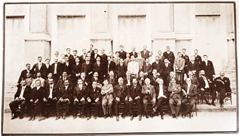
Figura 4. 65 de los asistentes al II Congreso Venezolano de Medicina. Foto tomada en el Palacio Legislativo de Maracaibo por el fotógrafo Julio Soto. Propiedad de Panorama (12, p.72, 75).

CVM el envío de delegados Farmacéuticos de los diferentes Estados y aceptar en la Sección de Higiene a los Ingenieros sanitarios.