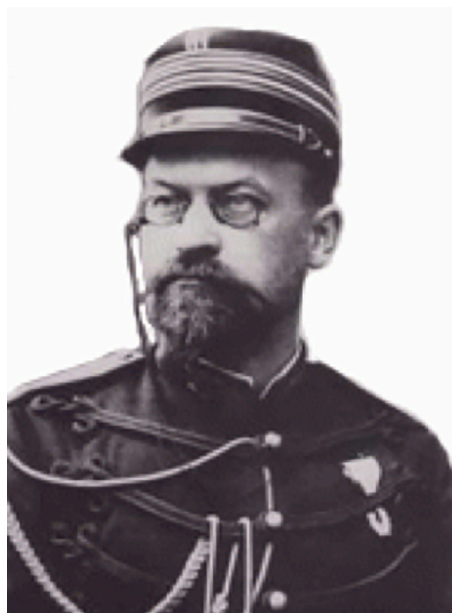
Figura 3. Dr. Charles Louis Alphonse Laveran (1845-1922).

Es importante recordar que la investigación fundamental sobre la malaria se realizó en 1880, en la cual el médico militar francés Charles Louis Alphonse Laveran (Figura 3), a su paso por Argelia, identificó unos parásitos en el interior de los glóbulos rojos en los pacientes con malaria. A partir de allí estableció que la malaria era causada por un protozooario. Esta investigación además de otros descubrimientos le valió el que le concedieran el Premio Nobel en Fisiología y Medicina en 1907. Los científicos italianos Ettore Marchiafava y Angelo Celli denominaron al protozooario Plasmodium (4).