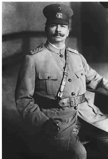
Figura 5. General Juan Vicente Gómez (1908-1935).

El día 30 de junio de 1923 la revista presenta un acuerdo de Duelo Público por el asesinato del General Juan Crisóstomo Gómez, primer vicepresidente de la República y Gobernador del Distrito Federal. La corporación repudia el hecho y expresa su pésame al Presidente de la República General Juan Vicente Gómez (Figura 5), al igual que designa una comisión en representación de tres Individuos de Número que hagan entregan en persona de acuerdo de Duelo (6).