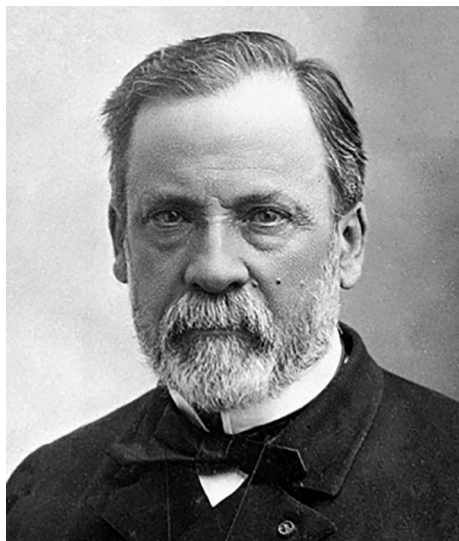
Figura 2. Louis Pasteur (1822-1895).