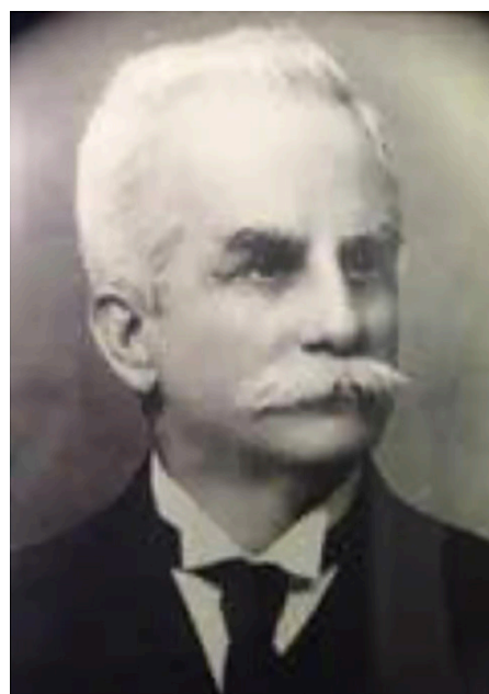
Figura 5. Dr. Arturo Ayala († 1922).

Para el cierre del mes de septiembre en el número 18 de la Gaceta Médica de Caracas, se reseña un homenaje póstumo al Dr. Arturo Ayala (Figura 5), fallecido el día 11 del mes de la publicación. Lo describen como un médico de aquilatada trayectoria, de gran precisión