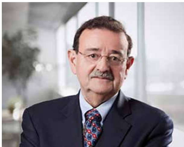
Figura 5. Dr. José Esparza.

de rebaño, ya sea adquirida por la infección misma o, idealmente, por la administración de vacunas. Afortunadamente se han desarrollado varias vacunas seguras y efectivas que ya han sido administradas en el mundo a más de 300 millones de personas. El programa de vacunación anti-COVID en Venezuela es muy deficiente y la Academia Nacional de Medicina ha ofrecido su asesoría para desarrollar un plan que de una manera equitativa asegure que la vacuna sea accesible a cada venezolano. La Academia Nacional de Medicina ha emitido 17 Boletines que definen su posición en diferentes aspectos relevantes a la vacunación contra la COVID-19 en Venezuela.