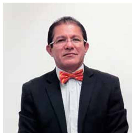
Figura 2. Dr. Paulino Vigil-De Gracia.

Por otra parte, establece que los síntomas en la mujer embarazada son muy similares al resto de la población y van desde asintomáticas, fiebre, tos, mialgia, ageusia, anosmia, diarrea, malestar general. Una mujer embarazada infectada con COVID-19 al compararse con una infectada en edad reproductiva tiene significativamente más riesgo de ingresar a una unidad de cuidados intensivos, de recibir ventilación mecánica invasiva y de muerte, el embarazo empeora el pronóstico. La posibilidad de transmisión vertical es poco probable y si ocurre por vía transplacentaria o perianal es en casos aislados y la evolución en el neonato es muy buena.