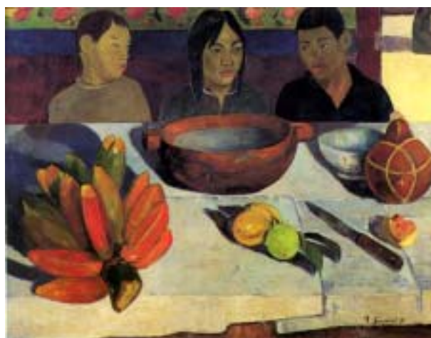
Figura 4. La comida o las bananas. 1891.

La figura central en el lienzo representa a una joven tahitiana en donde además de cumplir con el objetivo de estudiar a la nativa desde el punto de vista antropológico, la joven se encuentra sentada con su cabeza apoyada sobre la mano y el brazo