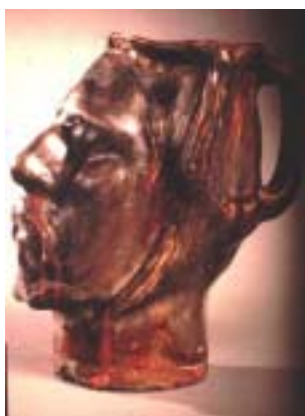
Jarrón con autorretrato.