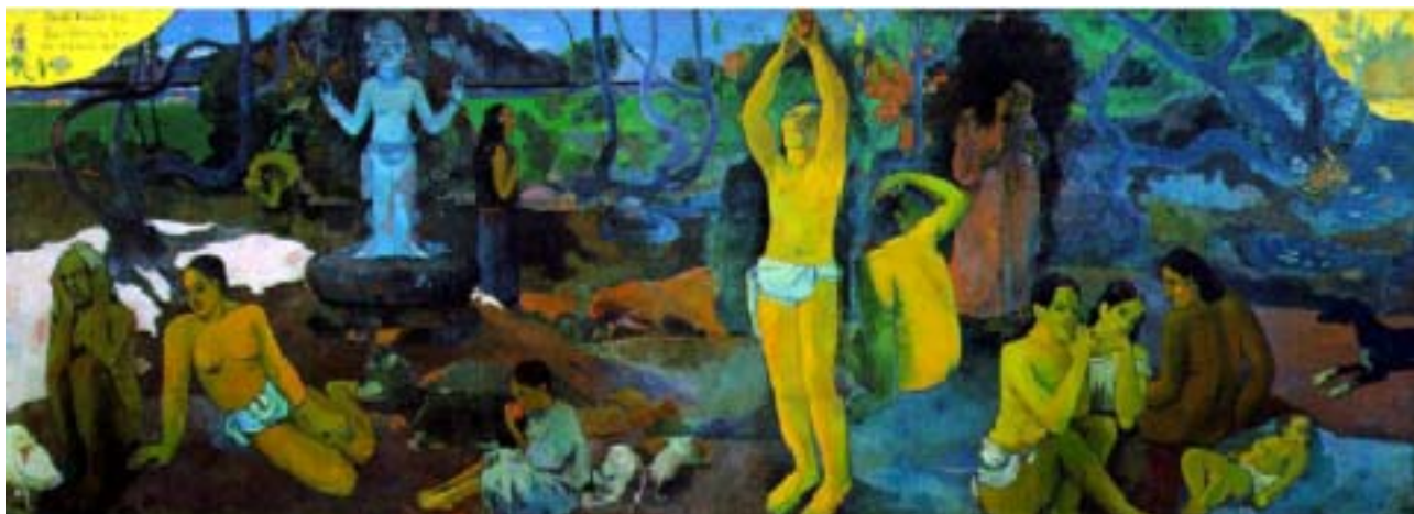
Figura 7. ¿De donde venimos, quienes somos, a donde vamos? 1897.

sus vestidos que sugieren tristezas que comentan a cerca del árbol de la ciencia el dolor causado por la misma ciencia, en comparación con la vida de los seres simples. Una figura se encuentra agachada con los brazos levantados y dirige su mirada a la pareja dedicada a escudriñar su destino. Otra figura central trata de alcanzar una fruta. El ídolo al fondo y a la izquierda se lo presenta con los brazos levantados, parece dirigirse al más allá. En el plano frontal se encuentra un niño consumiendo una fruta y con animales en su alrededor, y una bella joven está echada plácidamente, quizás influenciada por la presencia del ídolo. La escena se desarrolla en el bosque con un arroyo, en el fondo se ve el mar y las montañas de la isla vecina. Si bien hay variedades de colores y de tonos, hay un empleo abundante desde un extremo al otro de azul y verde y las figuras se destacan por un color anaranjado intenso. La tela debe leerse de derecha a izquierda. Se trata de una alegoría que toma como base las grandes cuestiones existenciales, sobre el nacimiento de la vida y la muerte, pero con el agregado de un tono enigmático y mágico que impregna esta obra maestra. Fue efectivamente la obra más ambiciosa de Gauguin, la cual fue realizada durante el diciembre de 1897, cuando se encontraba muy enfermo y deprimido. Poco después de su ejecución realizó el intento de suicidio.