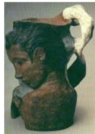
Leda y el cisne. 1887.