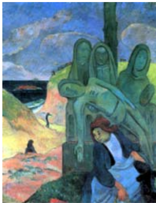
Figura 3. El Cristo verde. El Calvario breton 1889.

Se trata de otro “Calvaire” (calvario) ubicado en la costa, con los brazos estirados. El artista utilizó como base al grupo de la pietá , cercana a la iglesia de Nixon, en una aldea cercana a Pont-Aven. Las tres santas mujeres sostienen el cuerpo de Cristo, cuyo brazo derecho cuelga verticalmente e indica la rigidez de la muerte. Las figuras están representadas con tonos verdosos que sugieren una