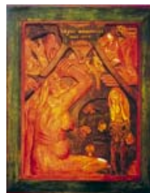
Soyez amoudeuses et vous sedez heudeuses. 1889.