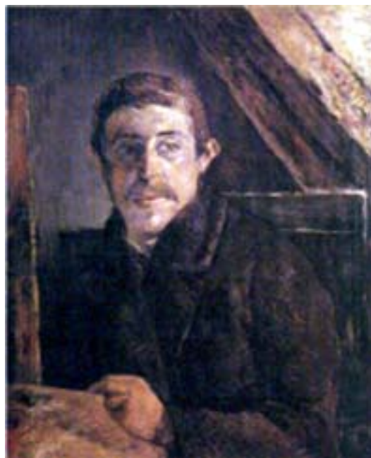
Figura 1. Autorretrato 1885.

La Playa de Dieppe (1885). En esta ciudad se aloja en casa de un amigo. Realiza este lienzo de una marina en la cual utilizó la técnica impresionista,