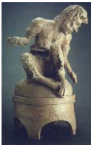
El fauno. 1896.

El fauno (1886), el cual fue su primer trabajo de cerámica sobre un tema de la mitología griega. Es la simbología de la sexualidad libre. Vaso con retrato