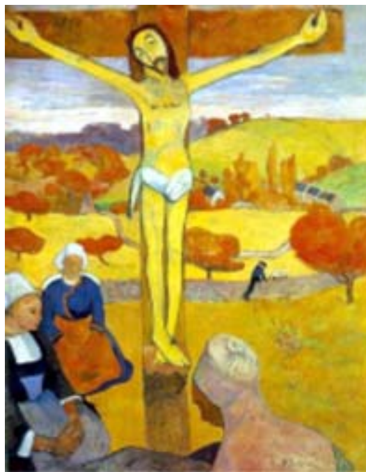
Figura 2. El Cristo amarillo. 1889.

El Cristo amarillo ( Le Christ Jaune ). (1889). Óleo sobre lienzo. Albright-Knox Art Gallery, Buffalo. El símbolo del sacrificio.