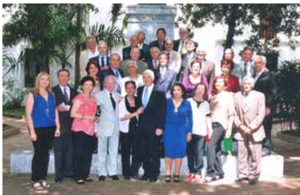
Figura 5. Integrantes de la Promoción de Médicos y Cirujanos “Dr. Eduardo Coll García” en el Patio Cajigal del Palacio de las Academias.