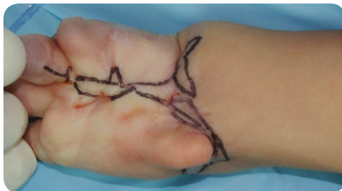
Figura 4. Fotografía. Demarcación de área a resear. Vista apical. (Duque, Gil, Lobo 2012).

La adecuación debe realizarse meticulosamente, retirando todo el tejido cicatrizal, las escaras de coagulación y tejidos inviables del lecho de la herida (necrosis por caute-