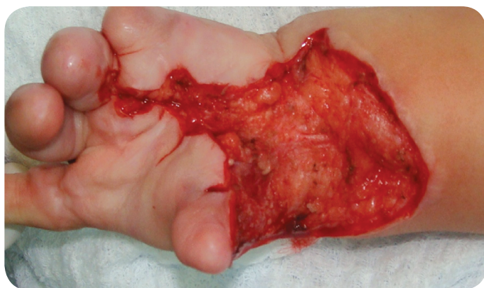
Figura 5. Fotografía. Área reseca y liberada. Vista apical. (Duque, Gil, Lobo 2012).

Se realizó la incisión con bisturí frío en los márgenes de la lesión a retirar biselando delicadamente hasta encontrar el plano subcuticular, luego con tijera de metzembaun se realizó el decolamiento sigilosamente del tejido a escindir hasta haber sido retirado totalmente.