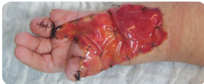
Figura 8. Fotografía. Apariencia a los 14 días. Vista apical. (Duque, Gil, Lobo 2012).

Día 21: Formación neodérmica completa. Remoción de la silicona. Cuando la neo dermis se haya formado y la vascularización sea adecuada, la capa de silicona es removida. La capa de integra ahora está incorporada, dejando la dermis autóloga en su lugar. (Figura 9).