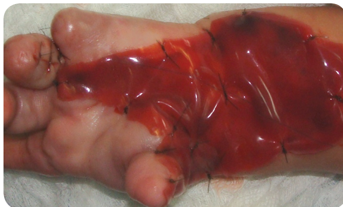
Figura 6. Fotografía. Lamina adaptada y fijada al lecho receptor. Vista apical. (Duque, Gil, Lobo 2012).

Sin embargo, para la incorporación de la matriz de regeneración al lecho del paciente, se necesita una adherencia continua y firme. En determinadas circunstancias es difícil asegurar esta adherencia mediante apósitos o vendajes.