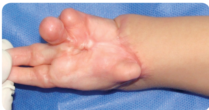
Figura 3. Fotografía. Sinequia palmar de mano izquierda en lactante mayor femenina posterior a quemadura de 3er grado de 1 año evolución. (Duque, Gil, Lobo 2012).

La matriz de regeneración dérmica, está contraindicada en pacientes con hipersensibilidad conocida al colágeno bovino, condroitin o los materiales de silicona. (6)