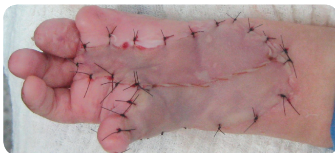
Figura 10. Fotografía. Autoinjerto epidermal completo. (Duque, Gil, Lobo 2012).

Día 28 – 56: Piel regenerada. El proceso de prendimiento del injerto y la sanación de la lesión es completado. La neo vascularización está establecida. En las pruebas clínicas, la neo dermis es indistinguible histológicamente de la piel de otra parte del cuerpo. (Figura 11).