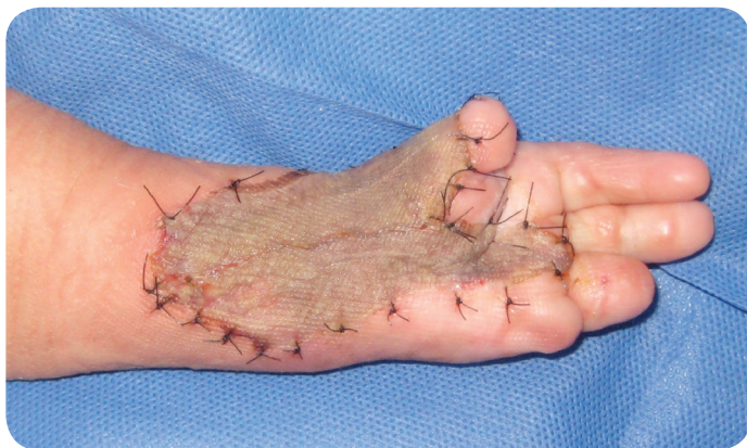
Figura 11. Fotografía. Autoinjerto epidermal laminar delgado. Integrado a lecho receptor a los 28 días. (Duque, Gil, Lobo 2012).