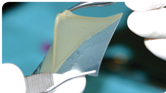
Figura 1. Fotografía. Lámina de matriz. Capa interna para sustitución dérmica. (Duque, Gil, Lobo 2012).

La capa que sustituye la epidermis esta hecha de una capa delgada de polisiloxano (silicona) para controlar la pérdida de humedad de la herida. (6) (Figura 2).