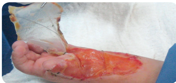
Figura 9. Fotografía. Apariencia a los 21 días y Remoción de cubierta externa. (Duque, Gil, Lobo 2012).

Día 21: Auto injerto epidermal. Una capa muy fina (aproximadamente de 0.0004" - 0.0006") de auto injerto epidermal (laminar o mallada y expandida) es aplicada a la neo dermis. (Figura 10).