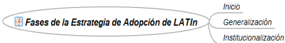
Figura 3.- Fases de la Estrategia de Adopción

Se definieron en esta estrategia de adopción a ejecutar tres fases durante los dos años, que se denominan Inicio, Generalización e Institucionalización, con el propósito de promover la apropiación de la iniciativa en cada una de las instituciones participantes, para lograr un carácter interinstitucional para la iniciativa. Esta temporización guía la acción en las anteriores dimensiones mencionadas que conforman el modelo de la iniciativa (ver figura 2).