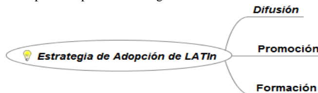
Figura 1. Procesos de la Estrategia de Adopción

Una estrategia de Adopción se define como una serie sistemática y bien planificada de acciones que combinan diferentes métodos, técnicas y herramientas, para lograr como objetivo la apropiación, empleando los recursos disponibles, en el tiempo establecido. Planificar y definir una estrategia integral para lograr y fomentar la adopción de una iniciativa que promueve la innovación, implica conceptualizar un conjunto de acciones a ejecutar, en forma de planes específicos, tendientes a la incorporación de los entusiastas en la fase de inicio, y de alcanzar en el menor período de tiempo a los rezagados. La Estrategia de Adopción que se propone a llevar a cabo en dos años para esta iniciativa, está conformada por tres procesos bases para la ejecución y aceptación de la producción colaborativa de libros de textos abiertos, los cuales se pueden apreciar en la figura 1.