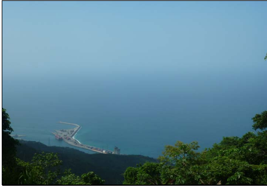
73/74 ISO: 100, V: 125, f: 16

Desde lo más alto de la montaña, el imponente Mar Caribe saluda a quienes buscan refugio en la naturaleza y se proyecta como un deslumbrante escenario natural. La unión del mar con la tierra produce un efecto visual distinto en el visitante.