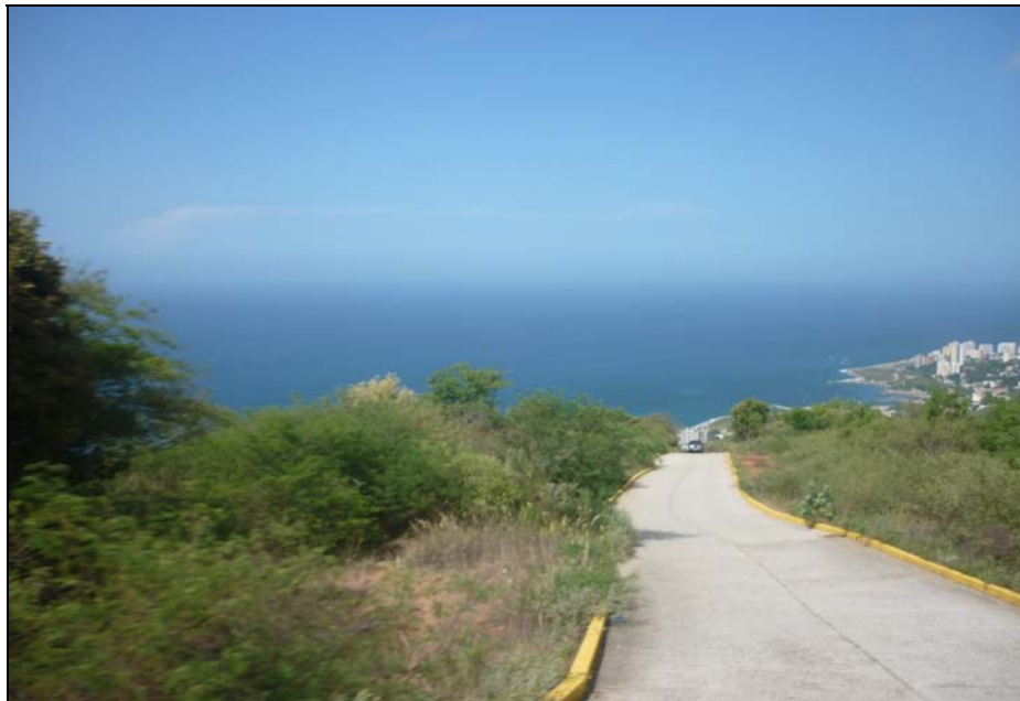
74/74 ISO: 400, V: 125, f: 11

Desde lo más alto de la montaña, el imponente Mar Caribe saluda a quienes buscan refugio en la naturaleza y se proyecta como un deslumbrante escenario natural. La unión del mar con la tierra produce un efecto visual distinto en el visitante.