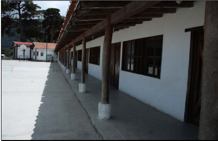
25/74 ISO: 400, V: 125, f: 11

Vista diagonal de la estructura rural conjunta de la escuela, el dispensario y la iglesia.