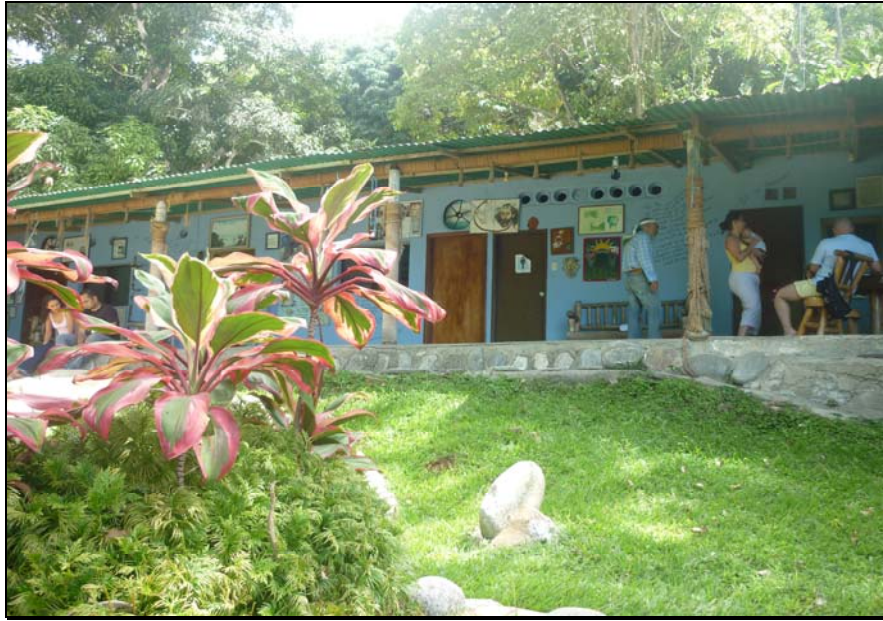
67/74 ISO: 100, V: 125, f: 16

Obras que parecieran decorativas se confunden con el paisaje, representando distintas creencias en torno a la visita del Museo Las Piedras.