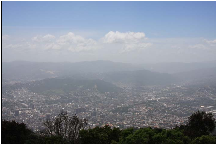
44/74 ISO: 100, V: 125, f: 16

La Virgen de La Milagrosa Bendice al pueblo y a toda Venezuela desde su capilla ubicada en San Isidro de Galipán.