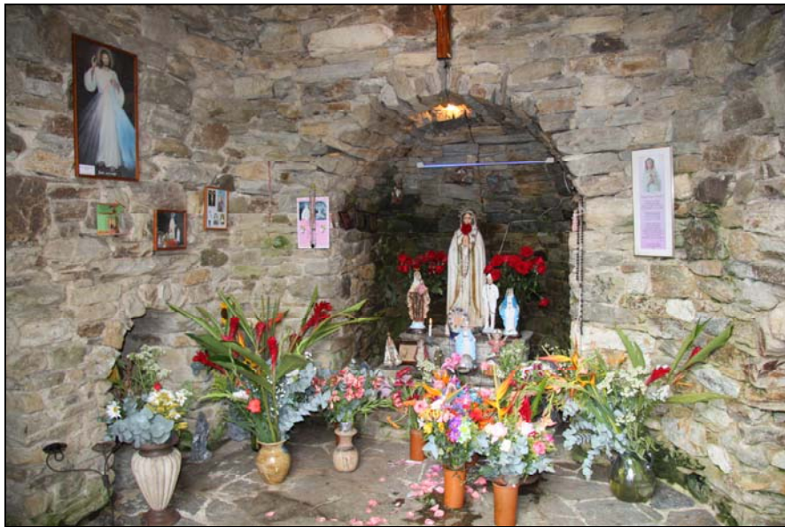
32/74 ISO: 100, V: 125, f: 16

Los feligreses aprovechan su visita al pueblo de Galipán para llevarle ofrendas a la gruta en la que afirman su devoción por la virgen de la Rosa Mística.