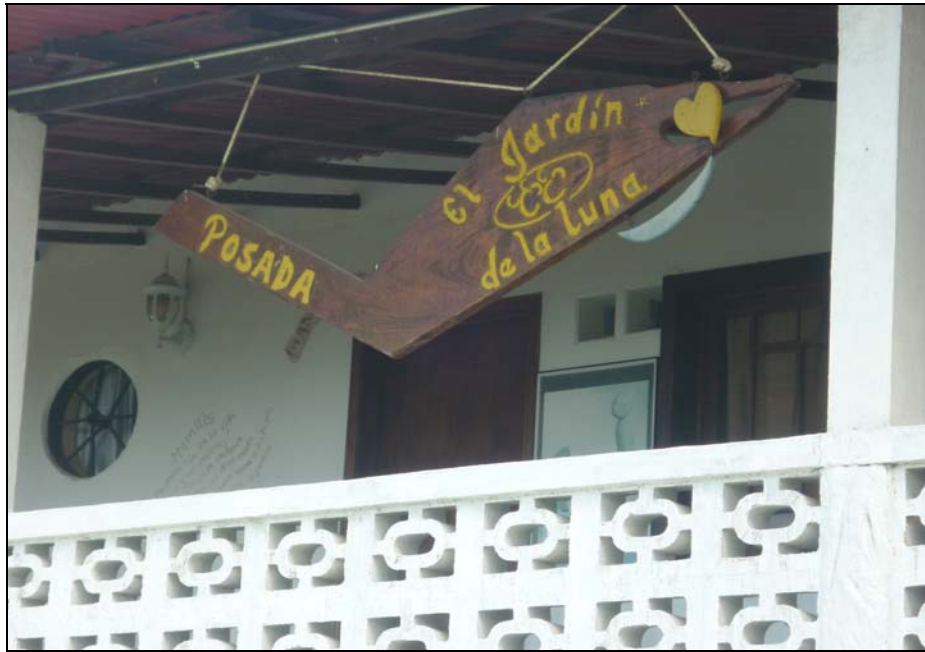
71/74 ISO: 400, V: 125, f: 11

Zoez, además de creador del museo ha reflejado su talento y afición por la poesía en los escritos que realiza en las paredes de las habitaciones y la posada. Cada uno refleja etapas que ha vivido el artista y la visión que tiene sobre situaciones de la vida.