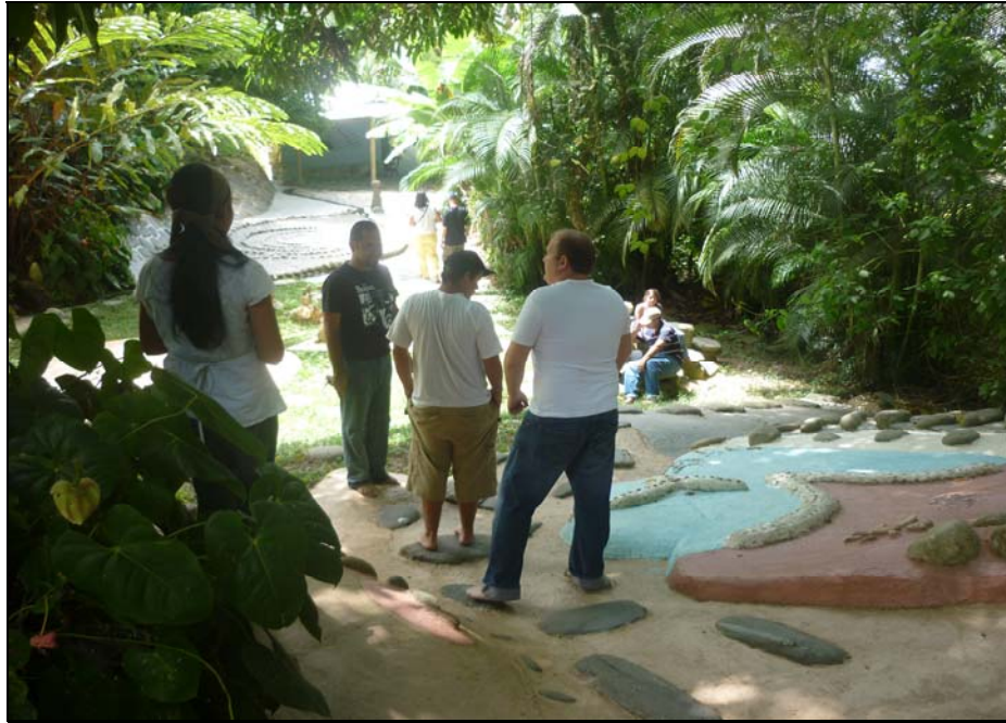
61/74 ISO: 400, V: 125, f: 11

La Mariposa Anfitriona es una de las tantas obras que el visitante debe pisar, en ella se cruzan los caminos del hombre y la mujer, donde cada uno encuentra la regla del jardín. "Aquí la ley es la armonía y el delito la polémica", "Aquí la ley es la participación y el delito la competencia"