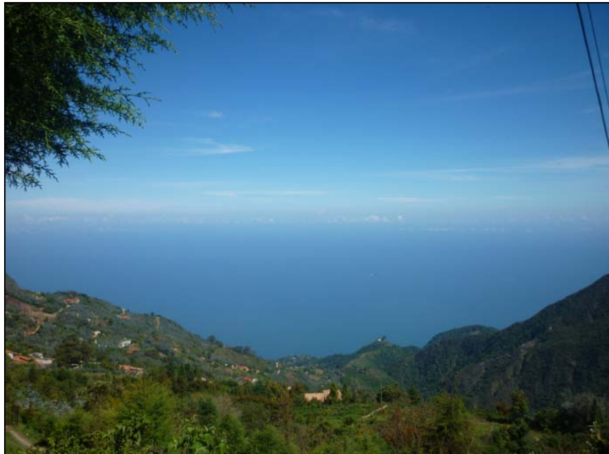
54/74 ISO: 100, V: 125, f: 16

Desde diferentes paradas, miradores o esquinas, se pueden observar los paisajes, las montañas y el extenso mar hacia el lado del Estado Vargas.