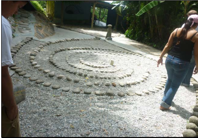
69/74 ISO: 100, V: 125, f: 16

La mayoría de las obras le rinden culto a la mujer y algunas tienen el fin de unir al hombre y la mujer. Su creador, se inspiró en el amor y en la madre naturaleza.