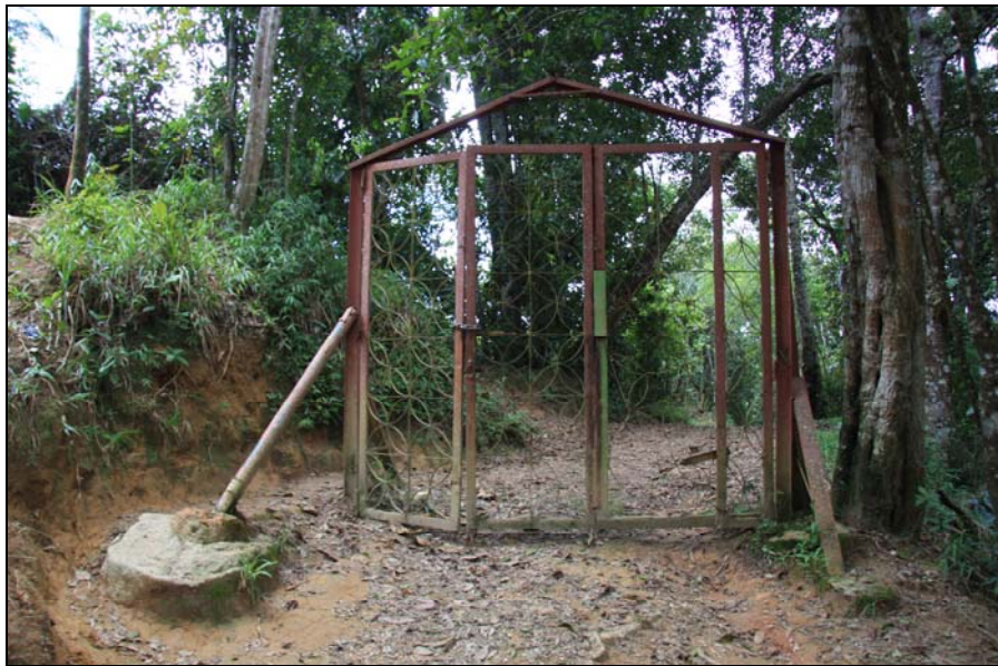
36/74 ISO: 400, V: 125, f: 11

Lleno de una vegetación poco frondosa y con abundantes helechos, se encuentra la imponente montaña rocosa El Picacho, ubicada hacia el lado oeste de Galipán. Su entrada está cerrada actualmente, pero eso no le impide a los galipaneros tenerlo como símbolo de su pueblo.