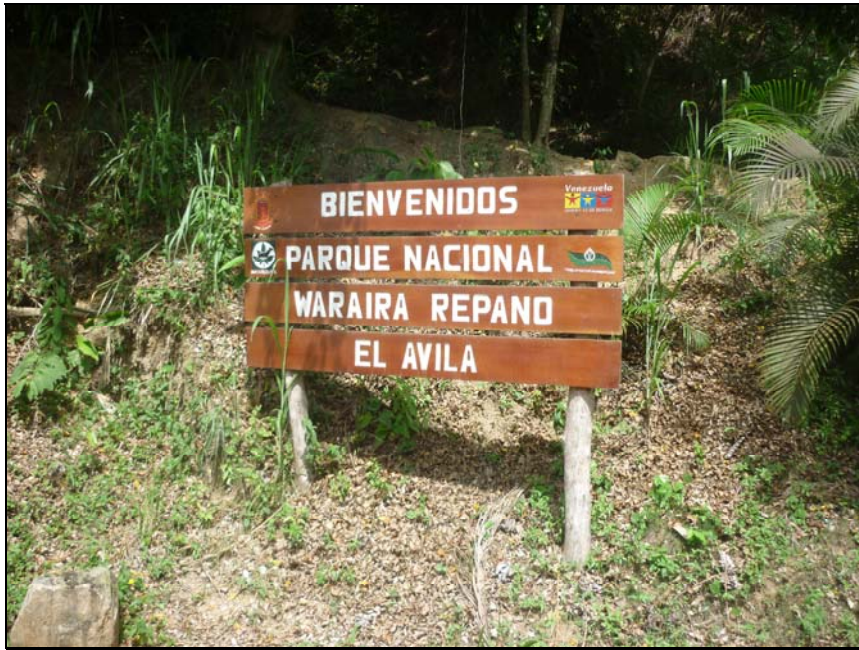
55/74 ISO: 100, V: 125, f: 16

Al llegar a San José de Galipán se encuentra un lugar mágico llamado Museo Las Piedras, formado de bellas obras todas realizadas con piedras marinas. Es el único museo de arte ecológico en el mundo. Este museo es de gran atractivo turístico.