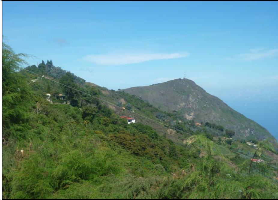
53/74 ISO: 100, V: 125, f: 16

Desde diferentes paradas, miradores o esquinas, se pueden observar los paisajes, las montañas y el extenso mar hacia el lado del Estado Vargas.