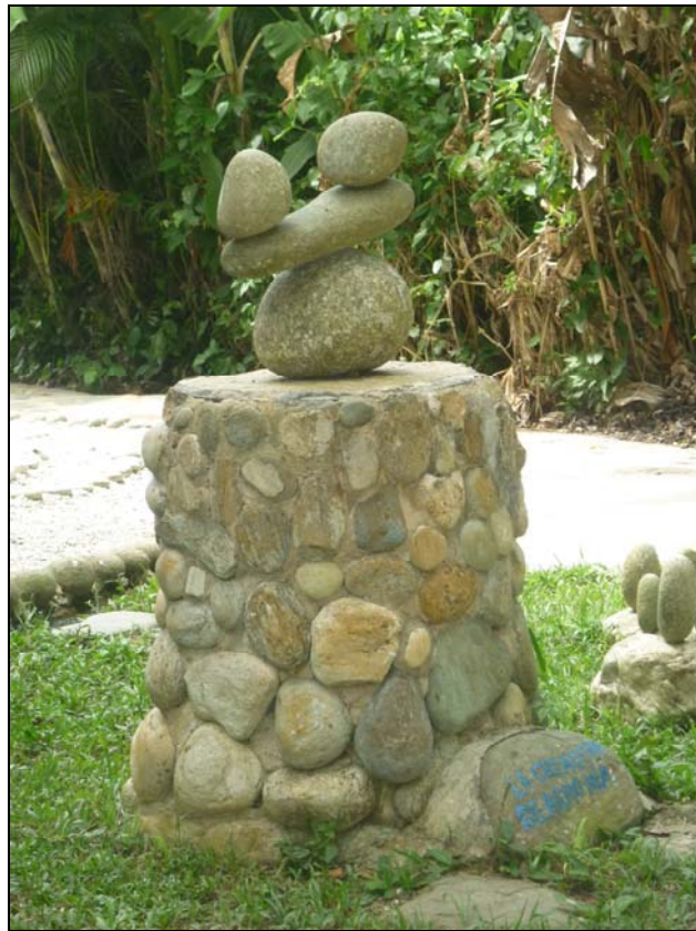
68/74 ISO: 100, V: 125, f: 16

Obras que parecieran decorativas se confunden con el paisaje, representando distintas creencias en torno a la visita del Museo Las Piedras.