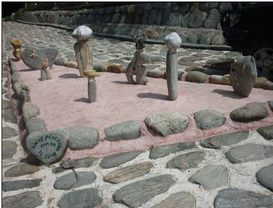
70/74 ISO: 100, V: 125, f: 16

La mayoría de las obras le rinden culto a la mujer y algunas tienen el fin de unir al hombre y la mujer. Su creador, se inspiró en el amor y en la madre naturaleza.