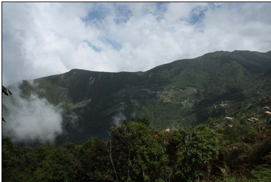
40/74 ISO: 400, V: 125, f: 11

Visitar Galipán a mediados de los años 60-70 era toda una aventura, había que ir con botas y morrales, además de carpas para acampar, porque era un viaje muy largo para los excursionistas. Hoy en día con la facilidad de los rústicos se puede subir y bajar el mismo día, sin necesidad de equipo especial.