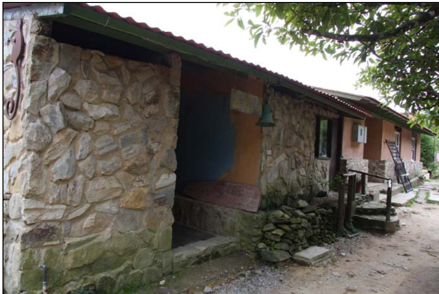
30/74 ISO: 400, V: 125, f: 11

Sin embargo, el clima húmedo, la lluvia y los altos costos de los materiales de construcción impiden mantener por mucho tiempo algunos sectores y lugares de las construcciones y carreteras del poblado de Galipán.