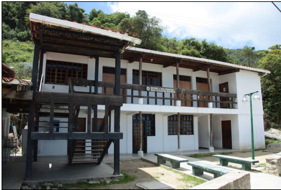
26/74 ISO: 400, V: 125, f: 11

Vista diagonal de la estructura rural conjunta de la escuela, el dispensario y la iglesia.