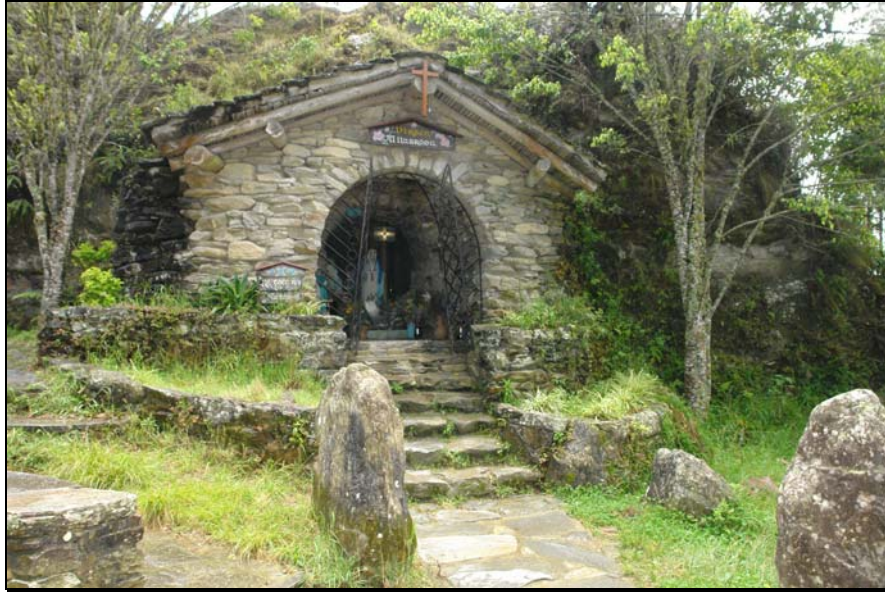
43/74 ISO: 100, V: 125, f: 16

La Virgen de La Milagrosa Bendice al pueblo y a toda Venezuela desde su capilla ubicada en San Isidro de Galipán.