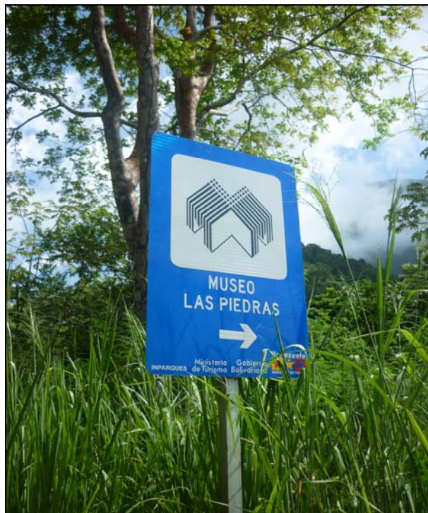
56/74 ISO: 100, V: 125, f: 16

Al llegar a San José de Galipán se encuentra un lugar mágico llamado Museo Las Piedras, formado de bellas obras todas realizadas con piedras marinas. Es el único museo de arte ecológico en el mundo. Este museo es de gran atractivo turístico.