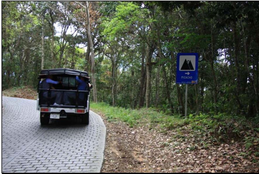
35/74 ISO: 400, V: 125, f: 11

Lleno de una vegetación poco frondosa y con abundantes helechos, se encuentra la imponente montaña rocosa El Picacho, ubicada hacia el lado oeste de Galipán. Su entrada está cerrada actualmente, pero eso no le impide a los galipaneros tenerlo como símbolo de su pueblo.