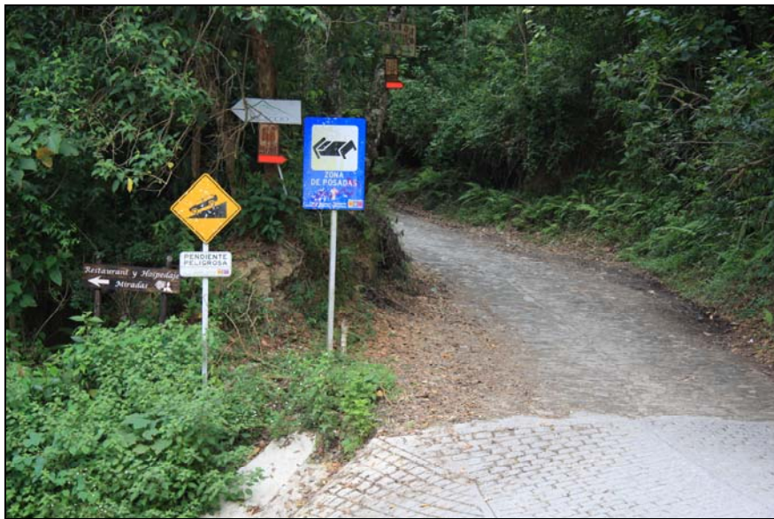
34/74 ISO: 400, V: 125, f: 11

A pesar de que en los últimos años se han adelantado proyectos de remodelación de las vías (Granzón), todavía existen sectores sin pavimentar. Es importante destacar las altas subidas y bajadas que tienen los distintos caminos de Galipán, por lo que se hace obligado un gran número de señalizaciones sobre prevención y advertencias.