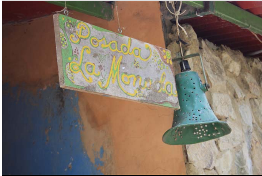
29/74 ISO: 400, V: 125, f: 11

Sin embargo, el clima húmedo, la lluvia y los altos costos de los materiales de construcción impiden mantener por mucho tiempo algunos sectores y lugares de las construcciones y carreteras del poblado de Galipán.