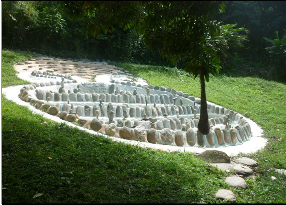
63/74 ISO: 400, V: 125, f: 11

Diferentes sectores con distintas modalidades de reflexión y relajamiento conforman el Museo Las piedras.