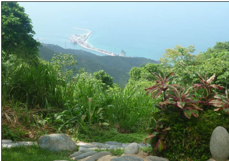
72/74 ISO: 100, V: 125, f: 16

Zoez, además de creador del museo ha reflejado su talento y afición por la poesía en los escritos que realiza en las paredes de las habitaciones y la posada. Cada uno refleja etapas que ha vivido el artista y la visión que tiene sobre situaciones de la vida.