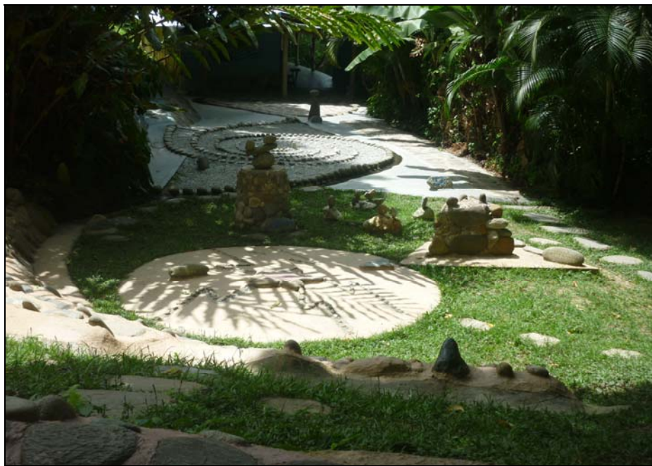
62/74 ISO: 400, V: 125, f: 11

La Mariposa Anfitriona es una de las tantas obras que el visitante debe pisar, en ella se cruzan los caminos del hombre y la mujer, donde cada uno encuentra la regla del jardín. "Aquí la ley es la armonía y el delito la polémica", "Aquí la ley es la participación y el delito la competencia"