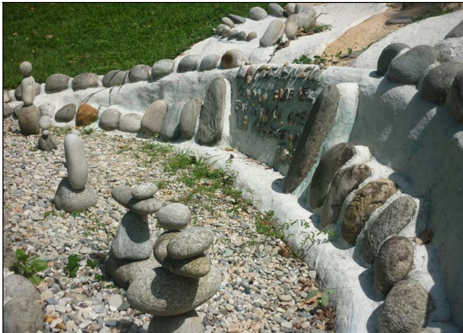
64/74 ISO: 100, V: 125, f: 16

Diferentes sectores con distintas modalidades de reflexión y relajamiento conforman el Museo Las piedras.