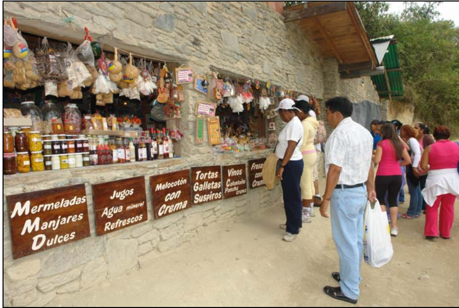
39/74 ISO: 100, V: 125, f: 16

Visitar Galipán a mediados de los años 60-70 era toda una aventura, había que ir con botas y morrales, además de carpas para acampar, porque era un viaje muy largo para los excursionistas. Hoy en día con la facilidad de los rústicos se puede subir y bajar el mismo día, sin necesidad de equipo especial.