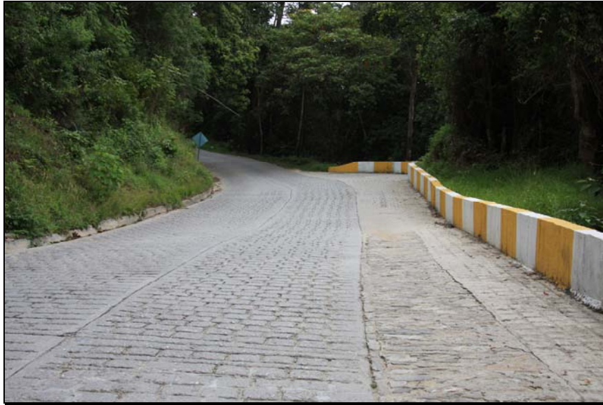
33/74 ISO: 400, V: 125, f: 11

A pesar de que en los últimos años se han adelantado proyectos de remodelación de las vías (Granzón), todavía existen sectores sin pavimentar. Es importante destacar las altas subidas y bajadas que tienen los distintos caminos de Galipán, por lo que se hace obligado un gran número de señalizaciones sobre prevención y advertencias.