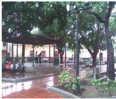
Lugar donde antaño se organizaban las musicales retretas.

La plaza Bolívar: Sitio donde muchas personas aseguran que ésta es la segunda estatua ecuestre construida de Simón Bolívar en Venezuela. Esta plaza mantiene el estilo de las plazas antiguas con sus faroles. y el lugar donde antaño se organizaban las musicales retretas.