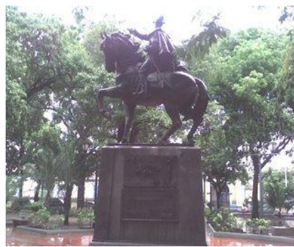
Segunda Estatua ecuestre construida de Simón Bolívar en Venezuela

La Catedral de Calabozo: Construida entre 1754 y 1790, es la mejor muestra de la influencia barroca sobre la arquitectura religiosa en Venezuela. Adentro