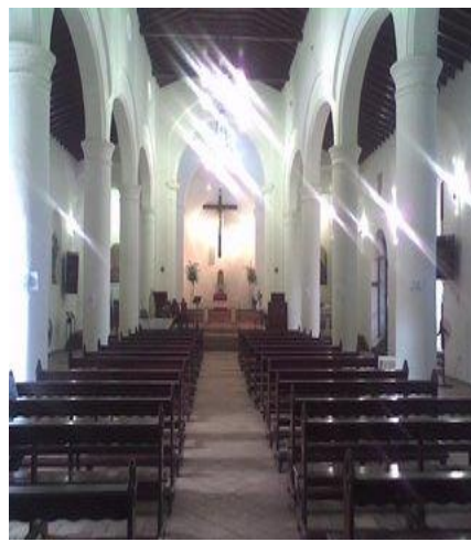
Entrada principal de la Catedral de Calabozo.

La Iglesia de las Mercedes: Esta joya colonial es una de las maravillas que guarda Calabozo, la Villa de Todos Los Santos. Con una hermosa placita al frente, que tiene en el centro la estatua de uno de los caudillos más famosos de Venezuela, José Antonio Páez, podemos observar la iglesia y su cúpula dorada.