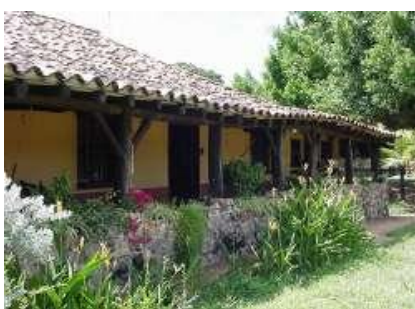
En las afueras de la posada

La posada es sencilla, agradable y cómoda. Sigue una línea arquitectónica tradicional con paredes en tapia y adobe, techos en madera y tejas, sobados con barro y pisos de Terracota. Tiene 6 cuartos con ventiladores.