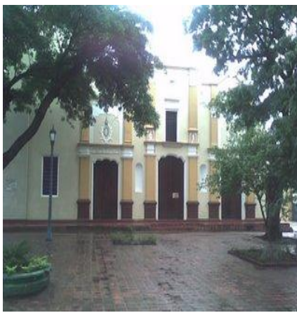
Frente de la Iglesia Las Mercedes.

Frente de La Iglesia Las Mercedes, está el Museo de la Ciudad, antigua casa de la familia Domínguez, ciudadanos humildes, que contribuyeron a la fundación de la “Villa de Todos Los Santos de Calabozo”, y que forman parte de todo el legado cultural e histórico que embarga a esta tierra.