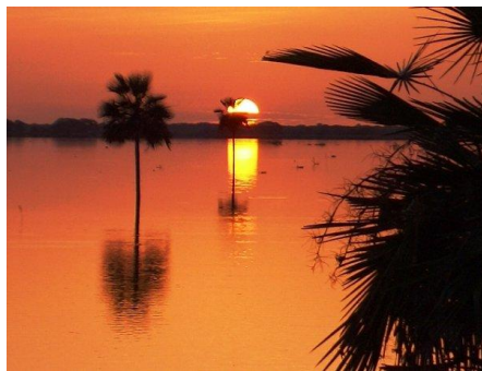
Atardecer en los Esteros de Camaguán.