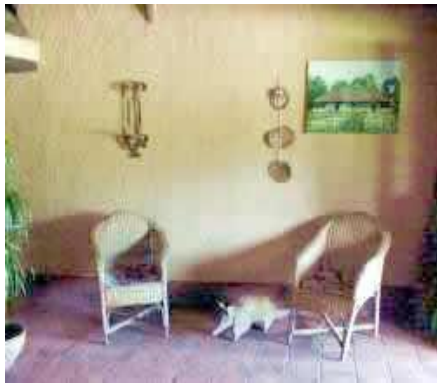
Detalle de la sala

Las áreas comunes son muy agradables y acogedoras. La comida es excelente y combina los elementos locales con la cocina de inspiración.