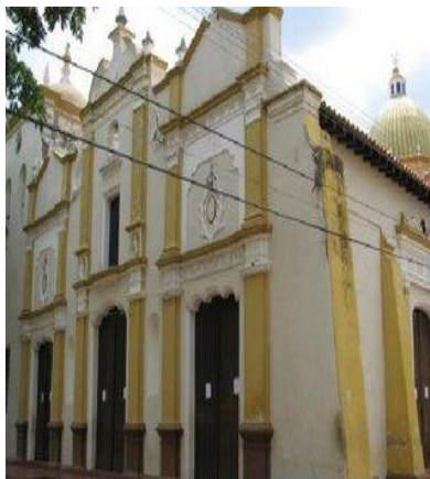
Vista lateral de la Iglesia Las Mercedes.