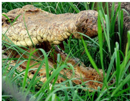
Caimán del Orinoco

El hato Masaguaral, además de ser un hato ganadero, es una reserva de caimanes del Orinoco y de babas, así como de flora y fauna de la zona.