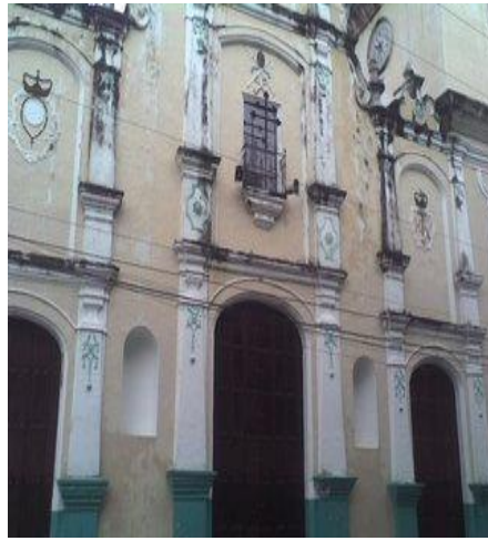
Fachada de la Catedral de Calabozo

podemos observar varios salones dedicados a los Arcángeles, a la Eucaristía, al Santo Sepulcro, etc. En las afueras se puede observar el material de sus paredes, y aunque los relojes ya no funcionan se puede ver como es la parte de su fachada. Los vitrales, así como sus esculturas son piezas de una gran belleza que adornan esta arquitectura barroca de la época colonial.