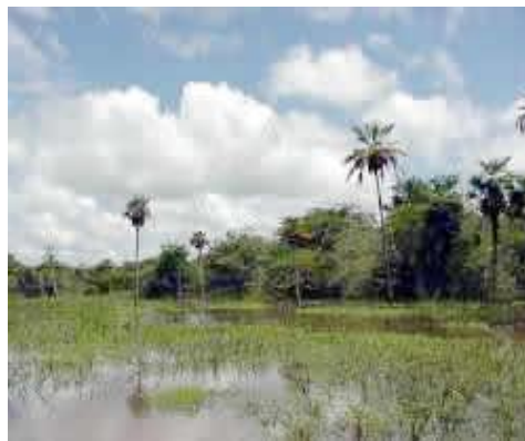
Vista del caño

El caño: Dentro del mismo hato, hay un caño navegable de junio a enero, en donde abundan las aves y ciertos animales como los araguatos, esos monos rojizos, característicos de los llanos. Usted podrá ver de cerca los nidos de las aves y observar los huevos en los nidos o los pichones esperando por su comida.