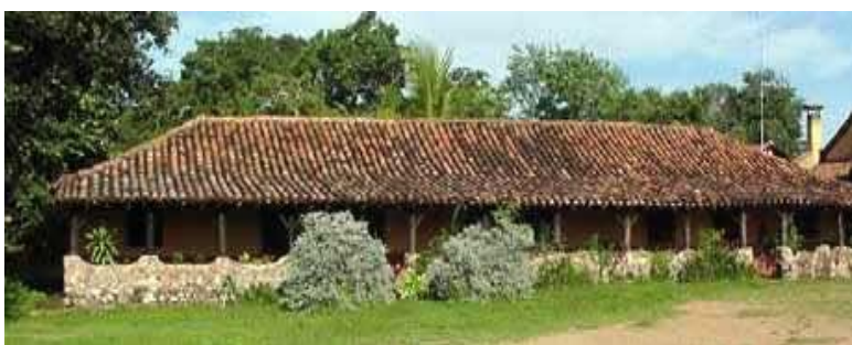
Hato la Fe

En el corazón del llano venezolano, a mitad de camino entre Calabozo y San Fernando de Apure, se encuentra un lugar excepcional para los amantes de la naturaleza: el Hato La Fe de Corozopando, frente a la Alcabala del pueblo Corozopando, en la carretera entre Calabozo y San Fernando de Apure. El recorrido en automóvil desde Caracas, es de 4 horas y media, y desde el aeropuerto de San Fernando de Apure, de 40 minutos.