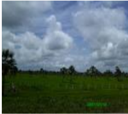
Amanecer en los Esteros de Camaguán.

anochecer en un estero, cuando cientos de aves se preparan para la noche. Bajo unos cielos de colores inolvidables.