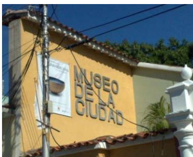
Museo de Calabozo

Frente de La Iglesia Las Mercedes, está el Museo de la Ciudad, antigua casa de la familia Domínguez, ciudadanos humildes, que contribuyeron a la fundación de la “Villa de Todos Los Santos de Calabozo”, y que forman parte de todo el legado cultural e histórico que embarga a esta tierra.