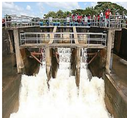
Sistema de Riego Río Guárico

El Sistema de Riego Río Guárico (SRRG), Ingeniero Generoso Campilongo, es una obra hidráulica que fue ejecutada durante el gobierno de Marcos Pérez Jiménez. Toma su nombre en honor al Ingeniero Generoso Campilongo. Fue ideada por la necesidad de controlar las inundaciones, el abastecimiento de agua potable para la población y su función más importante, el riego, la capacidad de almacenamiento y regadío, convirtiéndola en una de las más importantes del país.