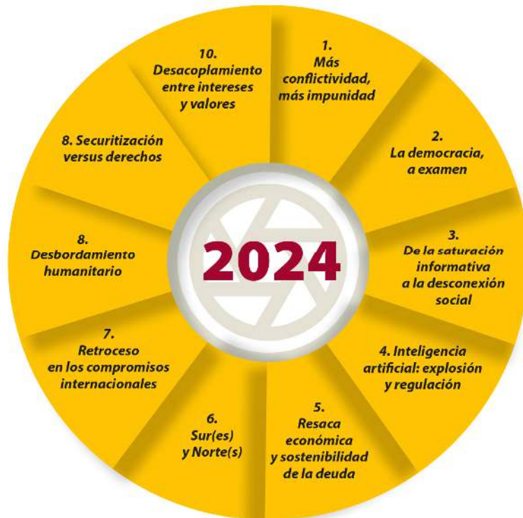
Figura 1. Diez temas que marcarán la agenda internacional