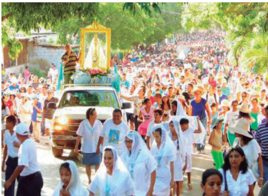
Foto 7. Un río de fe y tradición

Durante el trayecto, se puede observar en la gráfica a lo lejos el lugar sagrado y ancestral de la Cueva de El Piache y en un primer plano