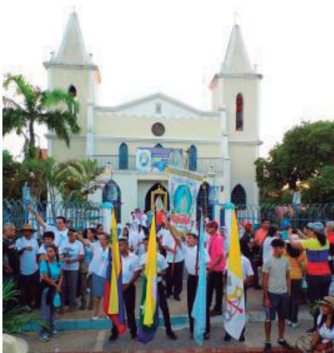
Foto 5. Inicia la Peregrinación con la Sociedad Favorecedora y los estandartes

Los primos comulgantes van vestidos de blanco y las niñas con la cabeza cubierta con velos de igual color, a la usanza de otras épocas; más atrás van los miembros adultos de la Sociedad Favorecedora. Delante de