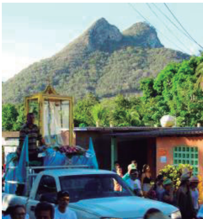
Foto 6. La Cueva de El Piache y la Imagen de la Virgen con su feligresía

En las afueras de la iglesia, una niña aguarda la salida de la sagrada imagen de la Virgen del Valle, ataviada en el estilo que el pensamiento Guaiquerí idealiza, fuera la vestimenta prehispánica del grupo y tras de ella, en la carroza que la transporta, se escenifica la entrada a la Cueva de El Piache, lugar sagrado para los Guaiqueríes, justamente donde el sacerdote Francisco de Villacorta habría escondido en el año de 1518 la imagen de la Virgen y designara a los Guaiquerí para su resguardo.