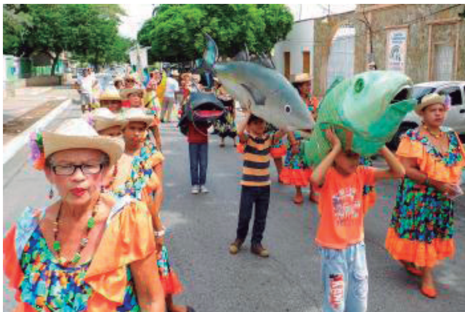
Foto 4. Las Guarichas y sus diversiones orientales presentes en la celebración