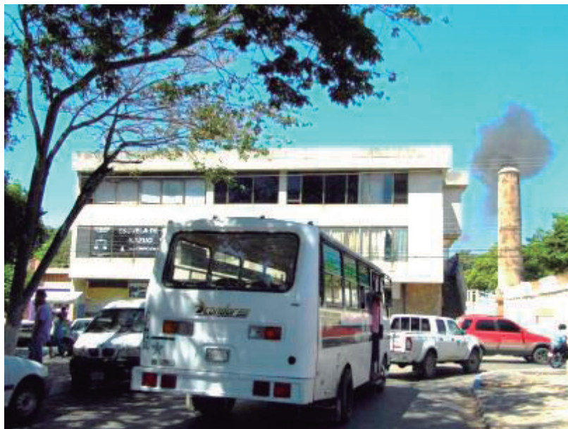
Foto 8. La Chimenea marca el retorno de los Guaiqueríes a El Poblado

120 Ya cerca de las 12 del mediodía, al llegar a El Poblado en la ciudad de Porlamar, específicamente a la Plaza Francisco Fajardo, se observa al frente la humareda de la Chimenea anunciando que los Guaiqueríes, que regresan de El Valle, vienen de venerar a la Virgen; este sitio es emblemático para este pueblo, pues otrora era donde realizaban una de sus principales actividades económicas y productivas. Así, cada 9 de septiembre, esa chimenea es encendida al meridiem, solo ese día, como un símbolo para mostrar que el sentimiento Guaiquerí persiste en su tradición, tal y como lo expresan al decir: "La chimenea encendida dice que de El Valle vienen los Guaiqueríes de hacer honor a nuestra Virgen".