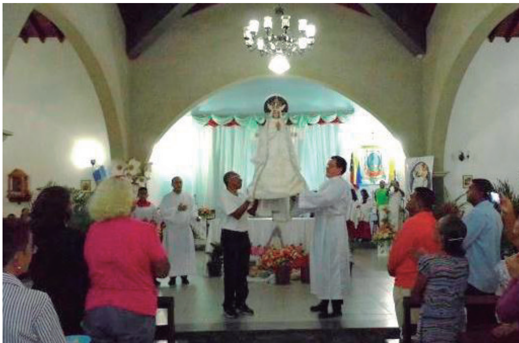
Foto 1. Entronización de la Virgen del Valle Guaiquerí 15