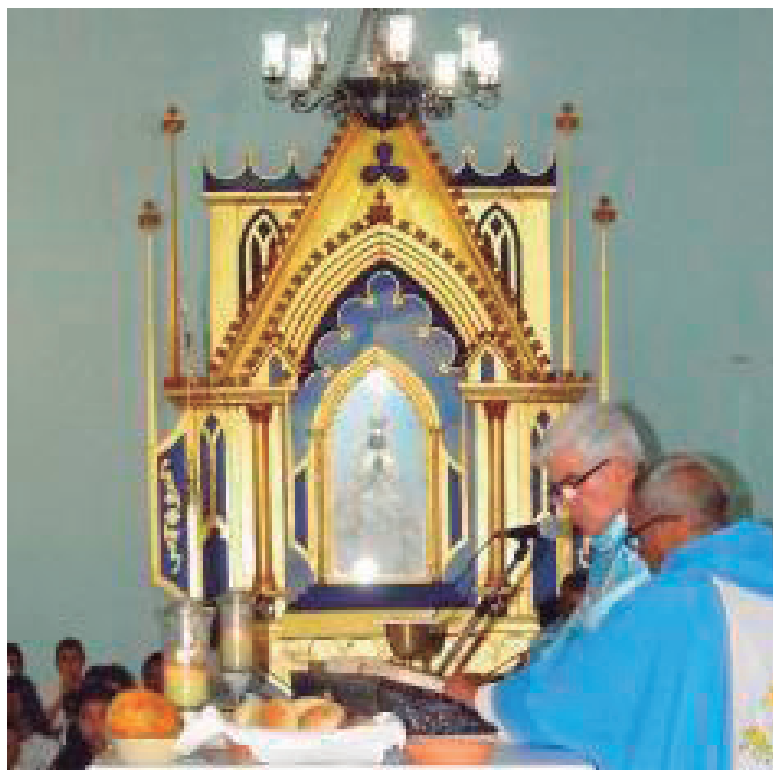
Foto 2 Misa Oficiada por Mons. Fernando Castro Aguayo, Obispo de Margarita

Pudimos presenciar durante la ceremonia que la sagrada imagen de la Virgen es entronizada entre aplausos y las más emotivas expresiones de veneración. El obispo Castro Aguayo realizó la homilía en la que pronunció un discurso de reconocimiento a los Guaiqueríes como los custodios de la Virgen: