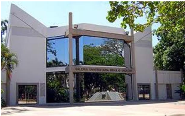
Galería Universitaria Braulio Salazar

Para tratar de definir, más que acercarnos a un punto de encuentro, es imperativo determinar primero cómo se conceptualiza la Galería. Veamos un acercamiento etimológico en la terminología empleada, según las definiciones del Diccionario de la Real Academia Española de la Lengua (DRAE), que es por lo demás bastante clásica.