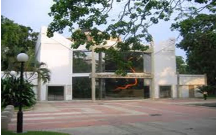
Fachada de la Edificación

obstante, la más acertada para asignársela a la institución que hoy estudiamos. Ahora bien, vista una vez más esta definición es relevante señalar las siguientes asociaciones: