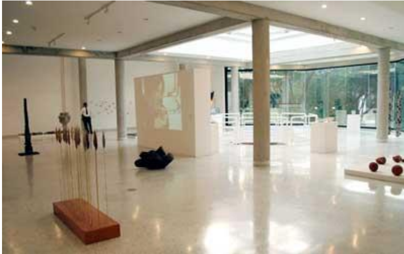
Sala de exhibición: Vista interior de la sala inferior

Finalmente, se hace necesaria ubicar aquí los objetivos del Salón Nacional de las Artes del Fuego.