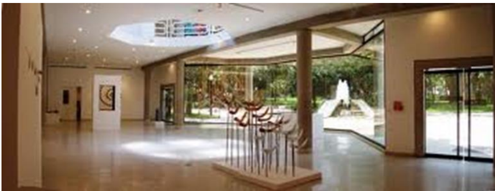
Vista interior donde se observa la claraboya central

Partiendo del concepto clásico de MUSEO concertado por el ICOM es importante destacar que la institución (Galería) cumple un rol protagónico en cuanto al quehacer cultural de la capital carabobeña, y específicamente en el ámbito museístico, no obstante, algunas salvedades. A pesar de que esta institución no está considerada como un Museo, cumple con todos los requerimientos propios del ICOM para definirla como tal.