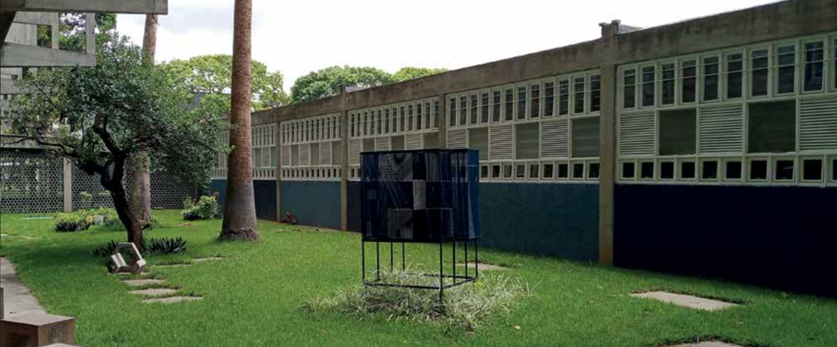
Jardín frente al cafetín FAUUCV

El IU fue creado en 1967, desde sus inicios se aboca al estudio de la compleja realidad de las aglomeraciones urbanas modernas. El Instituto de Urbanismo ha alcanzado una dimensión importante e innovadora dentro del ámbito académico, mediante la relación que se establece entre la investigación y la extensión. Su organización está compuesta por las Coordinaciones de Docencia, Investigación y Extensión, Diseño Urbano, Estructura Urbana, Transporte y Sistemas de Información, Política Urbana, Socioeconómica y Asistencia Administrativa.