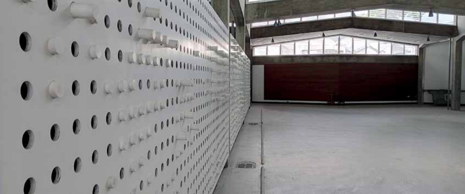
Taller Galia FAUUCV