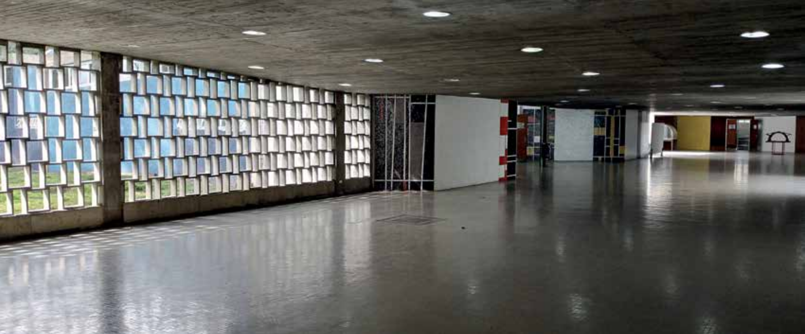
Planta baja FAUUCV