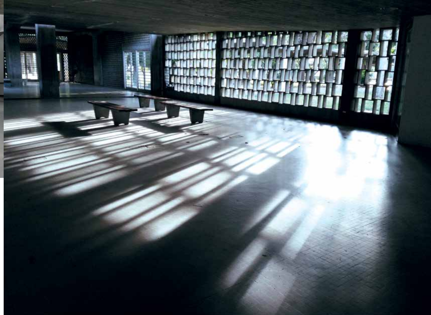
Planta baja FAUUCV

El actual Plan de Estudios (PE) fue aprobado por el Consejo de la Facultad de Arquitectura y Urbanismo el 17 de febrero de 1994 y se le han realizados pequeñas modificaciones desde el 2001 hasta 2011 1 . Este plan recoge no solo la pertinencia y convicciones de una nueva formación de arquitectos en Venezuela, sino que abre las puertas para la revisión y discusión permanente para determinar su vigencia e incorpora aspectos relacionados con una Escuela Experimental de forma transversal, en particular entre aquellas interrelaciones entre docencia, investigación y extensión.