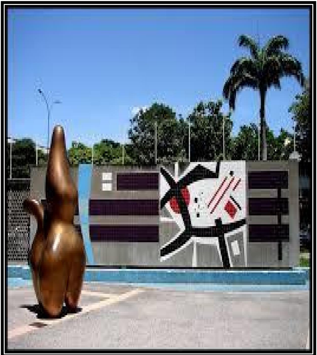
Pastor de nubes de Arp y mural Autor: Mateo Manaure U.C.V