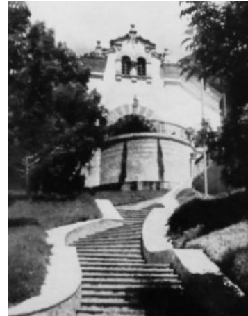
Imagen 6: Club Los Palos Grandes, Seijas (1938).

Junto con la exaltación del pasado colonial, al soslayar las herencias indígena y africana, es obvio que este se concibe solo en lo hispano, visto en edificios como los clubes sociales, convertidos en hitos urbanos y arquitectónicos de los nuevos desarrollos, los cuales mayoritariamente se emplazan sobre antiguas tierras agrícolas. Con ello se establece una vinculación histórica entre flamantes propietarios de estos parcelamientos y los anteriores terratenientes coloniales, legitimando su papel como sus “herederos”. Ante esta conservadora postura no es de extrañar la admonición de Seijas acerca de que el estilo venezolano es el colonial, en oposición al “Arte Moderno, de padres desconocidos”, el cual, incipiente en esa época en Venezuela, no duda en calificar como snob .