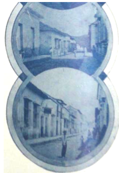
Imagen 1: Esq. Santa Teresa y Calle Carabobo. Seijas (1927a).

Escoge Seijas Cook para la primera página una serie vertical de tres fotografías sobre el colonial Templo de San Felipe, la calle vista desde la esquina de Santa Teresa y “Calle de Carabobo, avenida Sur, Santa Teresa hacia Camejo” (Seijas Cook, 1927a). En la segunda página, una fotografía de la “Esquina de La Bolsa.—Calle del Comercio”, imágenes decimonónicas pero que reflejan una ciudad colonial e inspiran en Seijas rechazo y a la vez añoranza de “Calles tranquilas, cielos sin telarañas de alambres, oídos vírgenes de ruidos y de klaxones, noches oscuras apenas alumbradas por los parpadeantes cocuyos de aceite de coco, portones escandalosos y desproporcionados... y otros tántos ( sic ) atrasos, [que] hicieron de la vida caraqueña del 1836, una sede conventual, tranquila y reposada” (ídem). Pero aunque exprese falencias y “atrasos” de la ciudad de 1836 como de la de 1927, también reconoce que la vida en esa Caracas del siglo XX es “más movida, más llena de colores, más vibrante y mucho más corta” (ídem).