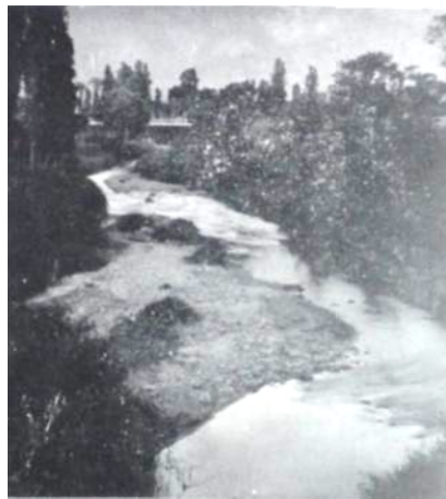
Imagen 3: Vista del río Guaire, Caracas, Seijas (1927b).

Una fotografía de un curso de agua flanqueado por frondosas riberas y la estructura de un puente al fondo, acompañaba este artículo de una página y un cuarto de extensión, donde el autor informaba que en época de su bisabuela “era el famoso río Guaire casi navegable, y hondo y cristalino... [y en el] Paraíso metropolitano” (Seijas Cook, 1927b) situado en el oeste de la ciudad, imperaban maleza y fauna silvestre (imagen 3).