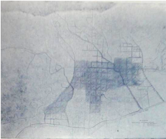
Imagen 2: Plano de Caracas, esc: 1:6.000 Seijas (1927a).

“Esa Caracas de nuestros antepasados la puedes contemplar a tus anchas, dilecta lectora de Elite, en las notas gráficas que acompañan estos apuntes históricos” (ídem): un plano y cuatro fotografías del siglo XIX. En la segunda página del artículo hay un plano esquemático escala 1:6.000 de la Caracas “del año que corre” (ídem) cuya parte en gris “es la superficie de la ciudad para 1836, según planos parroquiales de Pedro Pablo Díaz” (ídem), (imagen 1). Al respecto se indica que las parroquias San José, Altagracia y La Pastora en esos años son terrenos más o menos despoblados y que la parroquia Santa Teresa la crea Antonio Guzmán Blanco en 1876 al eliminar la de San Pablo y tomar parte de Santa Rosalía. Al no poder reproducir mediante grabados modernos los pocos daguerrotipos fotográficos existentes de 1830, se emplean fotografías hechas en Venezuela en 1864 por el alemán Federico Lessmann (imagen 2).