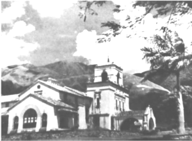
Imagen 5: Country Club Caracas, Seijas (1938).

A su entender hay “una innata sugerencia racial, al volver al campo trillado por el brazo del Conquistador... viejo estilo, abuelo de nuestro modo de sentir la vivienda, desde la enramada de desnudos horcones torcidos de la media agua criolla, hasta el rico y empinado alar de nuestros viejos templos es y será venezolano” (pp. 771-772), aunque no sea el único adaptable al trópico porque en las Antillas usan la pizarra y las mansardas. Hace énfasis en que este es el estilo apropiado porque “en cualesquiera de sus modalidades para nosotros tiene abuelo, más emotivos, por tanto, que el llamado Arte Moderno, de padres desconocidos, y que hoy comienza a sembrar sus raíces un tanto snob en nuestro suelo” (p. 772).