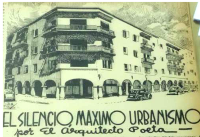
Imagen 7: El Silencio, Seijas (1945).

Una remembranza doméstica del autor comienza este escrito de una página con una perspectiva de la urbanización El Silencio de J.A (¿José Avilán?), específicamente del Bloque N° 6 de cuatro pisos, balcones y arcadas en planta baja, adaptado al chafalán de la esquina Angelitos (imagen 7). Alfombras y tapices de sus siestas tuvo que abandonar su perro cuando se mudaron al nuevo domicilio familiar, conducta que quisiera seguir su dueño para tomar el “panorama común de sus mejores años en la Caracas de su adolescencia, de su juventud de un progreso edilicio echando al suelo la Caracas de antaño; y como Felán, dejándose ir en la última camionada de la añoranza a encaramarse a la casa de Apartamentos y al Rascacielo” (Seijas Cook, 1945, p. 9), nostálgico anhelo de la ciudad del ayer y rechazo a los cambios que durante el siglo XX ocurren en Caracas.