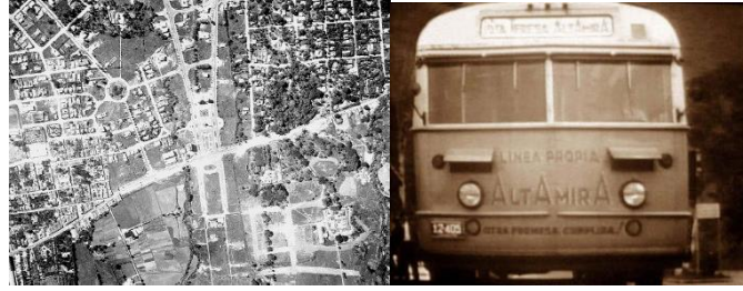
Figuras 12 y 13. Línea propia de Altamira