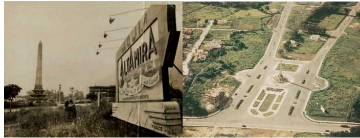
Figuras 6 y 7. Valla publicitaria de Altamira y plaza Altamira en 1945