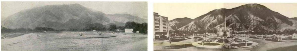
Figuras 1 y 2. Proceso de la urbanización Altamira entre 1945 y 1957