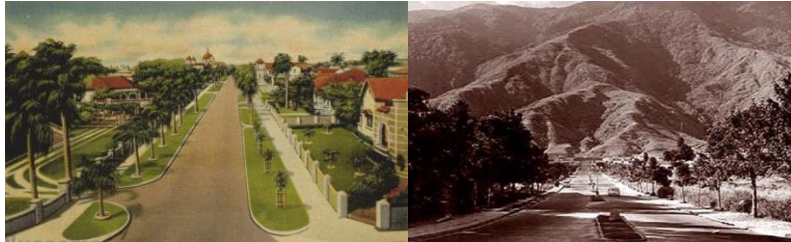
Figuras 8 y 9. Avenida Colombia en El Prado y avenida El Parque en Altamira

una estructura geométrica abstracta planificada de calles, dotada de los servicios complementarios “modernos” de la vida urbana. A partir de esta, respetando el rigor de las normas establecidas, el propietario podía desarrollar su proyecto habitacional respondiendo a los nuevos lenguajes de la modernidad arquitectónica, “entendidos en la época como lo novedoso y lo cosmopolita” (Bell, 1999). Esta urbanización de casas unifamiliares con jardines y anchas y largas avenidas, sembró en la mente de Roche la visión de desarrollar algo similar en Caracas (figuras 8 y 9).