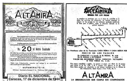
Figuras 4 y 5. Publicidad de la urbanización y de la línea de transporte público

Todos los beneficios ofrecidos constituían una estrategia publicitaria (figuras 4 y 5), dentro de las cuales destacaba la concepción de las anchas avenidas de 22 metros de sección, concebidos como un bidente formado por dos largos ejes no paralelos en dirección norte sur, la avenida Ávila, actual avenida Luis Roche, que asumiera posteriormente este nombre en honor a su fundador y la avenida El Parque, actual avenida San Juan Bosco, intersectadas en sentido oeste-este por la avenida 6ª Transversal.