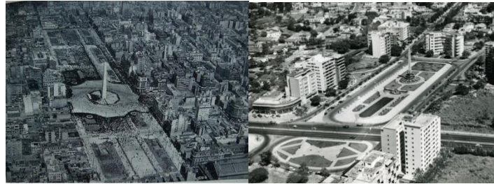
Figuras 10 y 11. Avenida 9 de Julio y plaza Francia de Altamira

(figuras 10 y 11). La preocupación por la jerarquización vial en las urbanizaciones había sido una constante en sus experiencias previas de Los Caobos y La Florida, en las que también ambientó las vías principales mediante recursos formales y espaciales de gran singularidad paisajística.