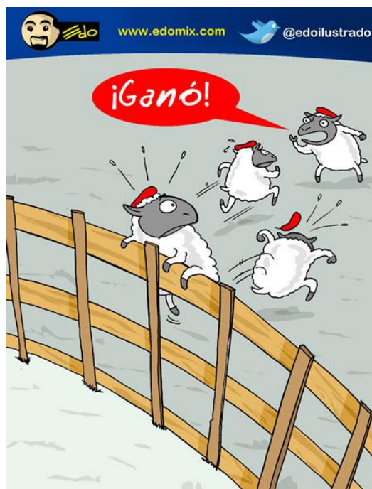
Figura 2. Caricatura de Zapata. Transmitida en el Programa Buenas Noches [GBV.BN.8-10-2012]

Parece curioso, que en esta diferenciación, entre los símbolos que circulan, se encuentre presente el de las gandalas y los camiones, ya que a diferencia de una oposición que utiliza sus pies como gran atributo y éxito de la evolución humana, se diferencia de aquellos que tienen que ser cargados en gandalas o camiones, lo cual abre paso a la idea de asociar al ser chavista con borregos, en tanto “hombres que se someten gregaria o dócilmente a la voluntad ajena” (Real Academia Española, 2001, Borrego, 3), quizás la imagen que presentamos a continuación, la cual se muestra en el programa aquí analizado, resume desde el punto de vista metafórico tanto esta idea, como la forma en que opera desde lo psicológico esta maquinaria chavista, en la cual “aparecen cuatro ovejas de un lado de una cerca o talanquera, con boinas rojas, una de ellas está sobre la cerca, las otras dos del mismo lado un poco más alejadas y sobre la cuarta aparece un globo rojo de letras blancas con el texto: “Ganó”...” [GBV.BN.8-10-2012 (716-718)].