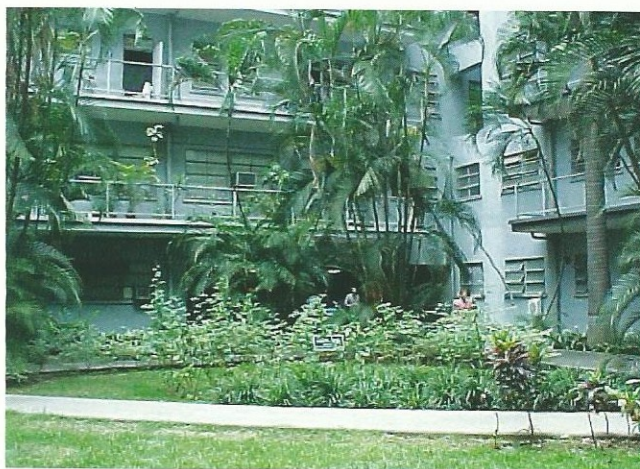
Figure 1: Patio Central del Hospital Universitario de Caracas.

Los establecimientos de salud están cambiando su filosofía del estado de enfermedad al estado de bienestar, para lo cual requieren ambientes curativos. El diseño arquitectónico, la luz natural, vistas al exterior, la privacidad, la accesibilidad y la facilidad de comunicación, la señalización clara, los materiales de construcción, acabados y mobiliario son fundamentales para conseguir un ambiente acogedor y agradable para pacientes y personal asistencial.