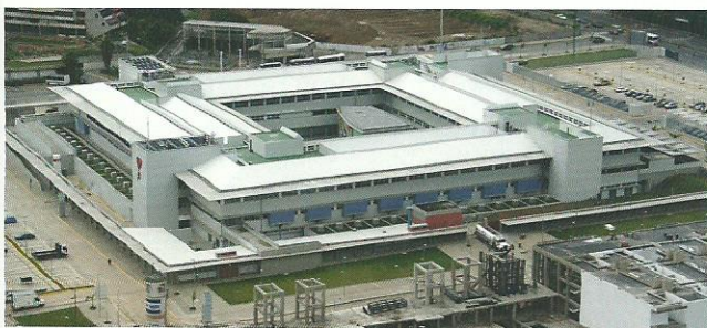
Figure 3: Hospital Cardiológico Infantil. Caracas, 2006.

Las tendencias nos indican la construcción de edificaciones de baja altura y con integración con el entorno, incorporación de patios internos, visuales, iluminación y ventilación natural, así como también bajo impacto ambiental. Esta tendencia la podemos observar en los nuevos hospitales construidos en la región de Venezuela (figura 3).