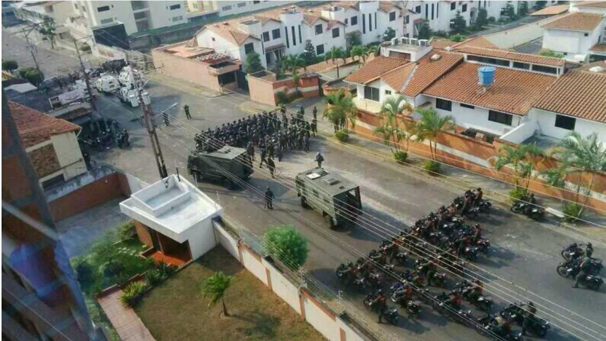
El Universal: Tanquetas y militares en nuevo en Av Principal de Pueblo Nuevo, San Cristóbal. Estado Táchira 30 de marzo de 2014.

Los conflictos de diferente índole, pueden agravar las enfermedades mentales y /o psiquiátricas pre existentes, constituyendo una verdadera calamidad en los países de recursos medios y bajos , donde generalmente hay limitado número de profesionales de la salud en la esfera mental y poco acceso de las personas a dichos servicios (35 ), lo cual se agrava por la escasez de medicamentos para dichas enfermedades causadas por el conflicto en sí , o por desabastecimiento previo, tal como está ocurriendo en nuestro país en estos momentos (16).