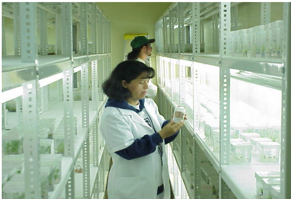
Instalaciones Laboratorio de Biotecnología. Estación Experimental La Joya. Bolivia. Foto. J.Izquierdo, Octubre 1999

La información, las denominaciones y los puntos de vista que aparecen en este libro son de la exclusiva responsabilidad de los autores y no constituyen la expresión de ningún tipo de opinión de parte de la Organización de las Naciones Unidas para la Agricultura y la Alimentación con respecto a la situación legal de cualquier país, territorio, ciudad o área, o de sus autoridades, ni en lo concerniente a la delimitación de sus fronteras o límites.