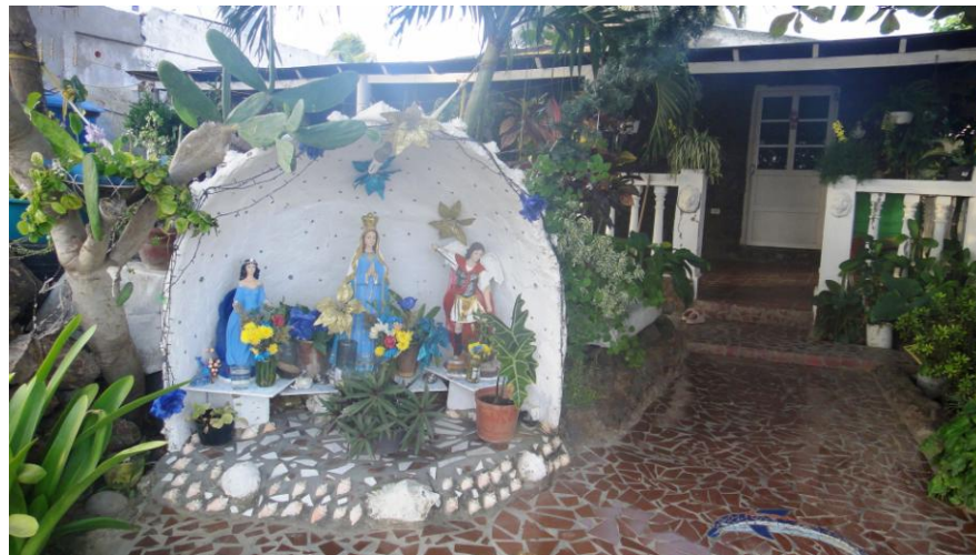
(Casa en El Yaque)

Para la mayoría de las casas de la calle principal de El Yaque, sus jardines están conformados por palmeras y matas de uvas de playa; el mar es su patio trasero y a sólo pasos de sus puertas parquean peñeros y lanchas, que son sus herramientas de trabajo, ya que también se caracterizan por ser un pueblo pesquero.