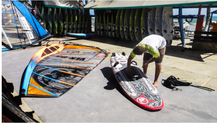
(Equipo de windsurf – Foto por: Susan Munévar)

El windsurf es considerado un deporte de élite, y efectivamente no es económico, los equipos son costosos porque nada se elabora en el país, pero es costoso sólo a nivel de equipos, más no en la infraestructura porque sólo necesitan un lugar para almacenar los equipos y el mar.