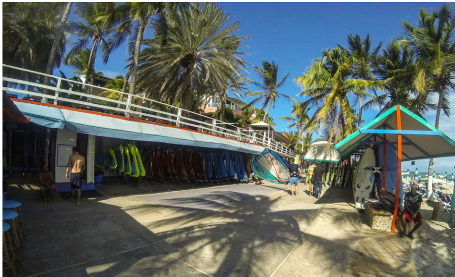
(Club Nathalie Simon)

El Yaque es el mejor lugar del país para aprender y practicar windsurf, según sus locales. Desde finales de la década de 1980 llegaron los primeros windsurfistas y empresarios extranjeros que vieron en el pequeño pueblo margariteño un gran potencial para convertirse en uno de los mejores lugares del mundo para la práctica del deporte, y así fue.