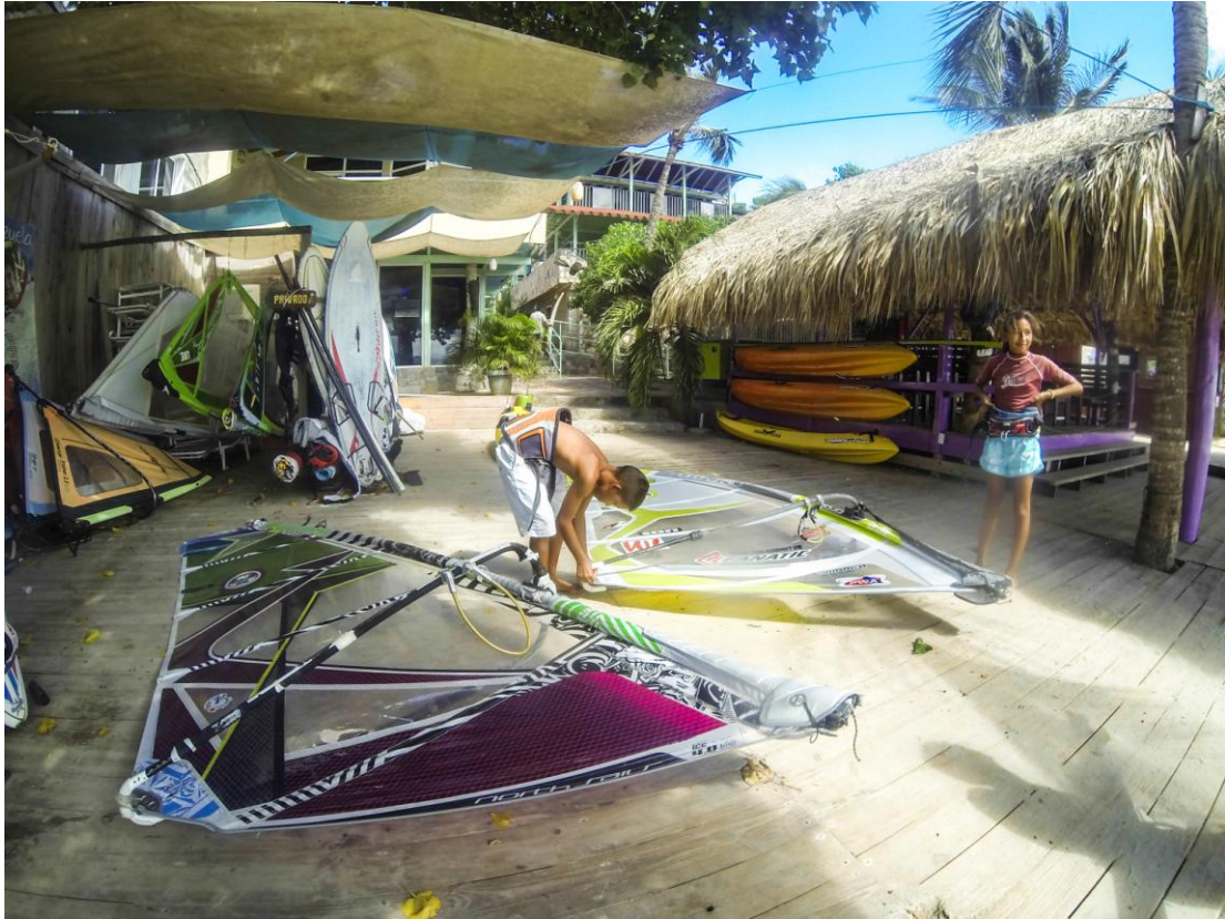
(Niños de la Fundación Yaque Extremo)

La Fundación Yaque Extremo representa un paso adelante para los niños que desean aprender y crecer en el windsurf nacional, les ofrecen la oportunidad de utilizar los equipos y de participar en las competencias nacionales.