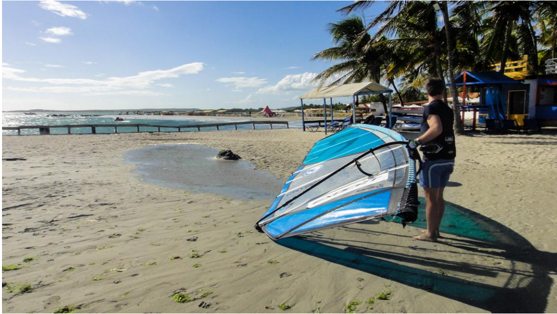
(En la foto: Turista)

Aún hay turistas de todo el mundo que visitan El Yaque para practicar windsurf. Sin embargo, con la eliminación de los vuelos directos internacionales del Aeropuerto Internacional Santiago Mariño, ubicado en Margarita, ha bajado de manera abrupta la visita de los extranjeros.