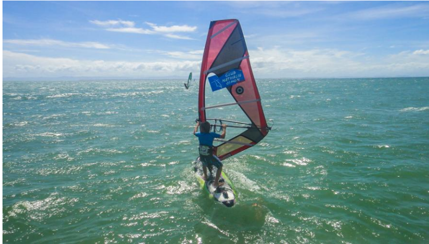
(Futuro del windsurf venezolano)

No hay un día en El Yaque que no se vea un niño navegando, motivo que demuestra que la mayor esperanza del pueblo la crean ellos, aún sin darse cuenta.