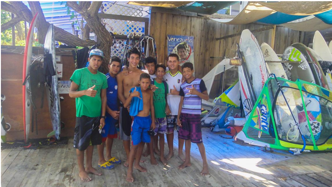
(Chicos de la Fundación Yaque Extremo)

El windsurf nacional ha tenido que enfrentarse a fuerte condiciones, pero siempre ha salido victorioso; llegó a El Yaque para hacer del pueblo uno de los mejores lugares del mundo para su práctica, lo hizo crecer a nivel turístico, forjó sueños y disciplina en niños que al crecer colocaron la bandera nacional en la cima de las competencias mundiales, hoy, a pesar de que nunca ha tenido el apoyo del país entero, sigue dispuesto a mostrar sus bondades al que quiera conocerlo.