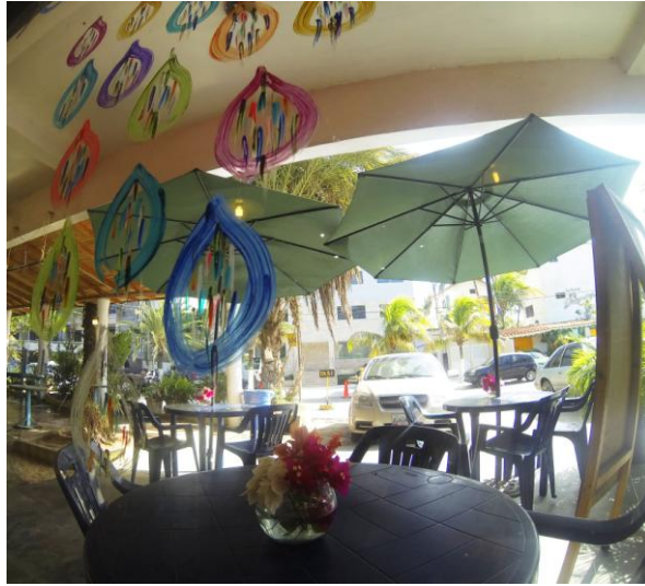
(Café Macedonia Point – Foto por: Susan Munévar)

Diariamente el pueblo ofrece todas las atenciones necesarias para una estadía placentera, cuidan todos los detalles y resaltan cada rincón de una manera pintoresca.