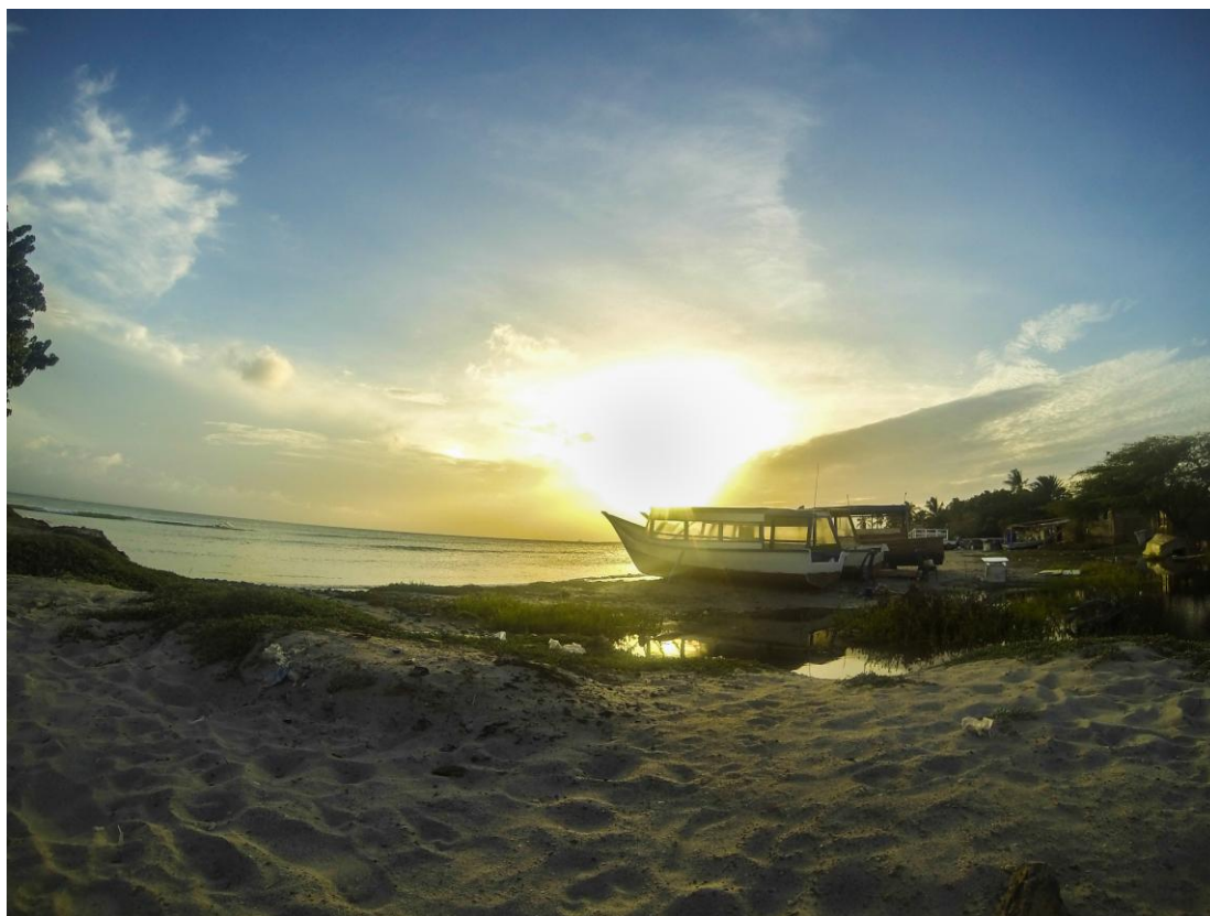
(Playa El Yaque)

El Yaque es un pueblo que vive y respira windsurf por doquier; es un pequeño lugar que posee los encantos caribeños desde su entrada hasta la cima de sus montañas lejanas, lleno de gente amable, carismática, trabajadores incansables y bendecidos por la dicha de estar siempre bañados por el sol y la refrescante brisa.