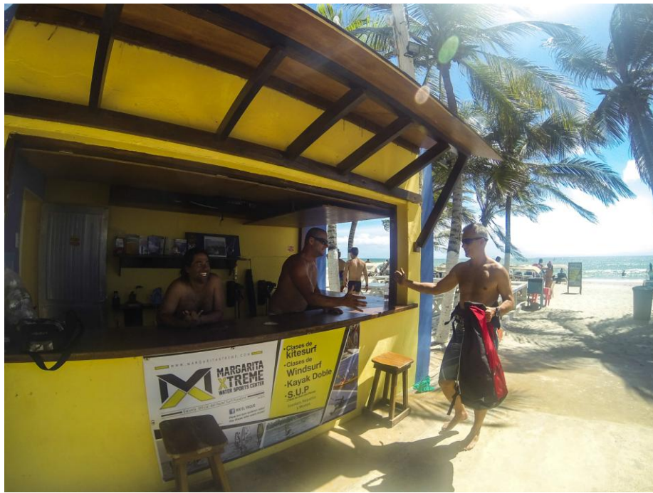
(Club Margarita Xtreme)

Por su parte, el club Margarita Xtreme , se instaló en Playa El Yaque en noviembre del año 2000 cuando Murray Sampson, un carismático escocés impulsado por su sueño de vivir en una isla del caribe, abrió la primera escuela de Kitesurf en Venezuela que a su vez era la primera de Latinoamérica y una de las primeras cinco del mundo.