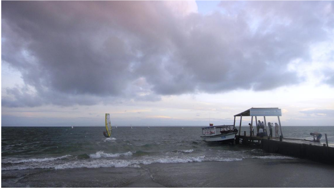
(El Muelle)

El windsurf venezolano posee un alto nivel competitivo, y los representantes de El Yaque gozan de ser reconocidos como los mejores del mundo, pero dentro del país el panorama es diferente, diariamente las condiciones se vuelven más fuertes no sólo para los atletas que intentan crecer a nivel competitivo, sino para el pueblo en general, que desde los últimos cinco años ha tenido que cambiar sus políticas de comercialización.