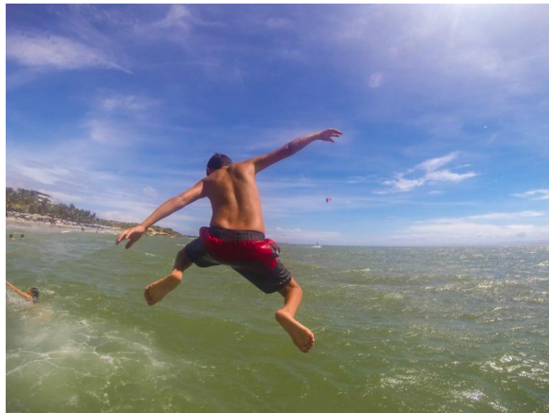
(En la foto: Niño saltando desde el muelle)

El turista siempre es bien recibido y atendido, y si desean practicar windsurf, son guiados por expertos.