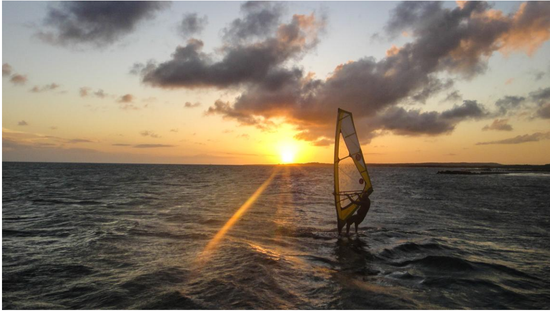
(Windsurfista en Playa El Yaque)

El windsurf es un deporte que se practica sobre una tabla parecida a la de surf provista de una vela, por lo que se requiere de buen viento para ser impulsados sobre el mar. El Yaque posee condiciones privilegiadas para la práctica de este deporte; el viento llega a la playa con fuerza de 4Bft a 7Bft (Escala de Beaufort sobre la fuerza de los vientos), lo que genera desde suaves brisas hasta muy fuertes vientos, y esto unido a sus aguas cálidas y poco profundas, y una temperatura anual entre los 26°C y 30°C, hace de El Yaque un lugar privilegiado por la naturaleza para la práctica del windsurf.