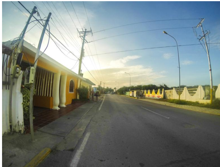
(Casa en la Avenida principal)

Las pequeñas casas en brillantes colores adornan sus calles. Hacer un pequeño recorrido por su avenida principal es una experiencia satisfactoria, se puede caminar con tranquilidad a cualquier hora del día y siempre se encontrarán pequeños detalles para observar y grabar en la memoria.