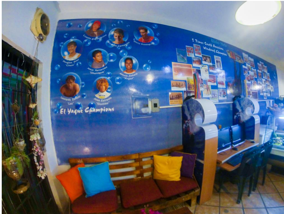
(Café Macedonia Point)

Los locales se han esforzado por resaltar en sus espacios la historia de sus campeones, con murales e imágenes de sus años de campeonatos ganados, o simplemente comentándoles a sus visitantes por qué El Yaque los llena de orgullo.