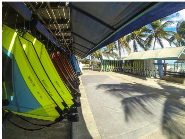
(Club Nathalie Simon –)