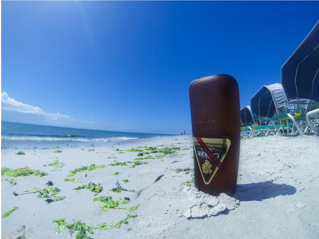
(La playa un lunes en la mañana)

En un recorrido mañanero por la playa cualquier día de la semana, se puede observar una gran cantidad de desechos sólidos tanto en la arena como en el agua.