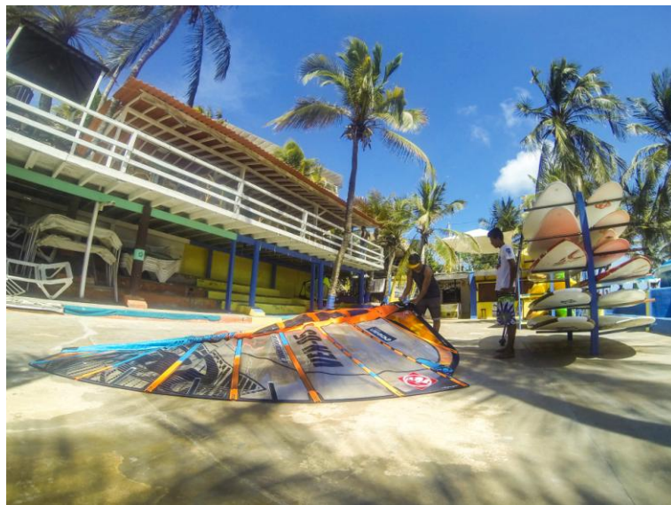
(Equipo de windsurf)

El windsurf es considerado un deporte de élite, y efectivamente no es económico, los equipos son costosos porque nada se elabora en el país, pero es costoso sólo a nivel de equipos, más no en la infraestructura porque sólo necesitan un lugar para almacenar los equipos y el mar.