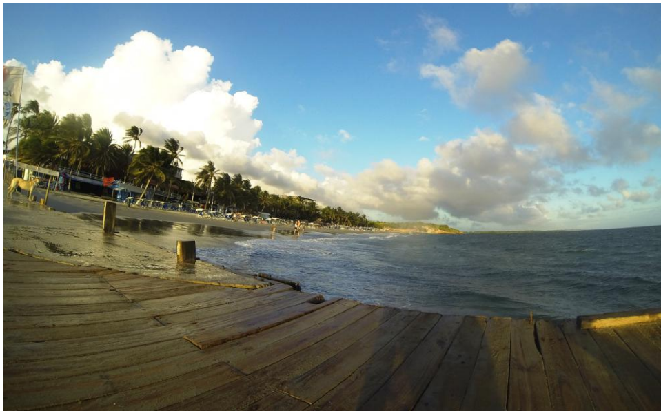
(El muelle)

Las maravillas de El Yaque son la suma de la bendición de la naturaleza y un pueblo que se encarga de enaltecer y cuidar los dones que han recibido. Esa es tal vez una de las cosas que debe tener en cuenta quien visite el lugar.