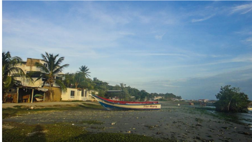
(Patio trasero de las casas)

Para la mayoría de las casas de la calle principal de El Yaque, sus jardines están conformados por palmeras y matas de uvas de playa; el mar es su patio trasero y a sólo pasos de sus puertas parquean peñeros y lanchas, que son sus herramientas de trabajo, ya que también se caracterizan por ser un pueblo pesquero.