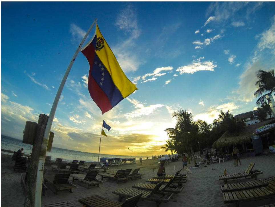
(Playa El Yaque)

Venezuela con su amplia zona costera y perfectas condiciones climáticas durante todo el año es un destino paradisíaco para muchos; mención especial merece la Isla de Margarita, en el Estado Nueva Esparta, mejor conocida como “La perla del Caribe”, lugar que anualmente recibe una gran cantidad de turistas nacionales e internacionales. Allí se encuentra El Yaque, un pequeño pueblo cuya playa es una de las más hermosas de la isla, además es reconocida internacionalmente como uno de los cinco mejores lugares del mundo para la práctica del Windsurf.