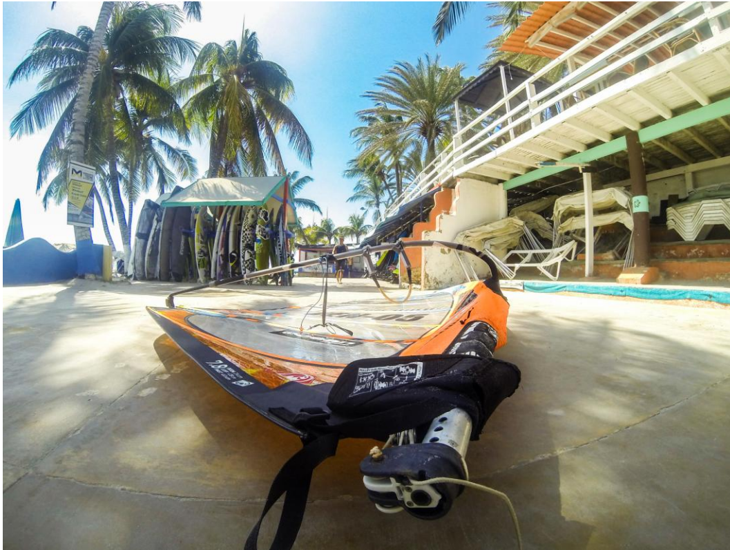
(Vela de windsurf)

Sin embargo, parte del verdadero éxito que podría tener el windsurf venezolano recae en quienes tienen la capacidad de apoyar a los niños y jóvenes que día a día crecen a nivel deportivo.