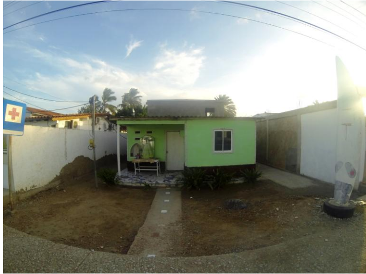
(Casa en la Avenida principal – Foto por: Susan Munévar)

Las pequeñas casas en brillantes colores adornan sus calles. Hacer un pequeño recorrido por su avenida principal es una experiencia satisfactoria, se puede caminar con tranquilidad a cualquier hora del día y siempre se encontrarán pequeños detalles para observar y grabar en la memoria.