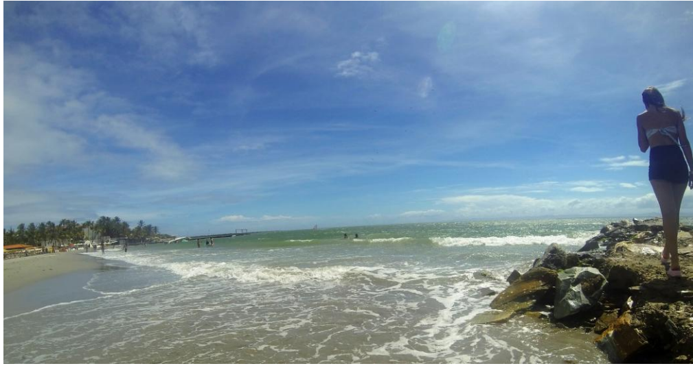
(Playa El Yaque)

Con una simple caminata podrán conocer toda la playa y observar de cerca su belleza y detalles.