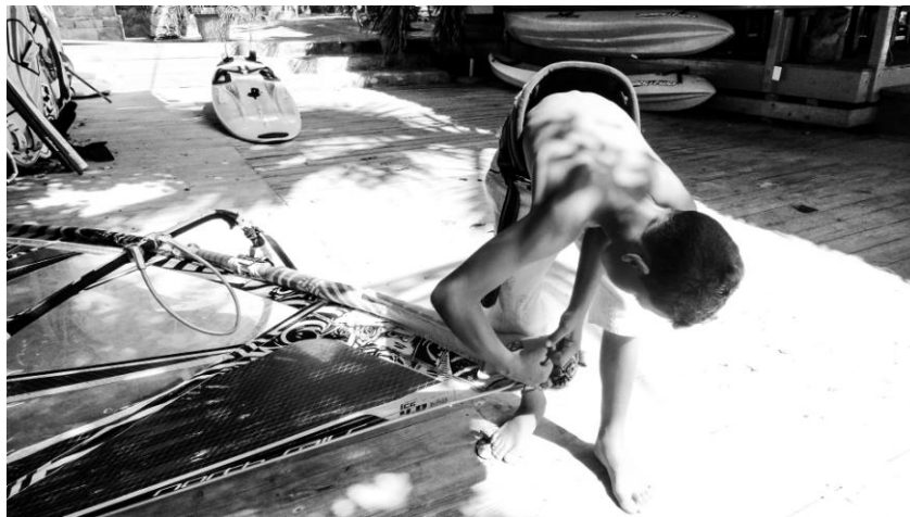
(Futuro del windsurf venezolano)

No hay un día en El Yaque que no se vea un niño navegando, motivo que demuestra que la mayor esperanza del pueblo la crean ellos, aún sin darse cuenta.