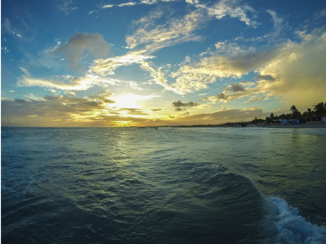
(Atardecer desde el muelle)

Un lugar que con sólo observarlo te regala historias, colores en el cielo, el sonido del mar y la brisa en el rostro, es simplemente un lugar obligatorio para visitar y disfrutar; eso lo saben muy bien los turistas nacionales e internacionales que han hecho de El Yaque un pequeño templo turístico.